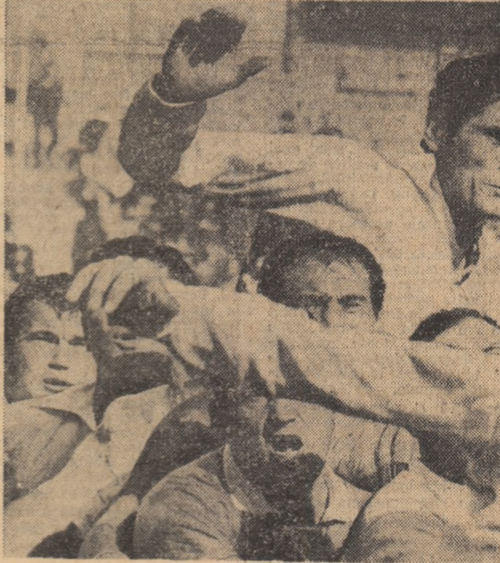
Începerea, la una din „tușele” partidei de rugbi Grivița Roșie — Dinamo

Citiți în pag. a 2-a relatări despre cele două licee