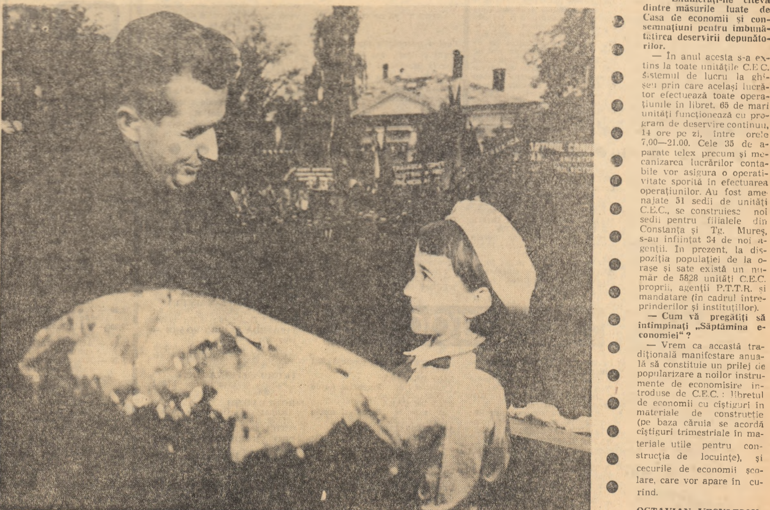
Reportaj realizat de GEORGE RADU CHIROVICI, ȘTEFAN BRATU, NICOLAE VAMVU, PETRU UILACAN