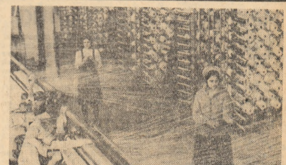
Aspect din secția preparărie a Uzinelor textile „Moldova” din Botoșani