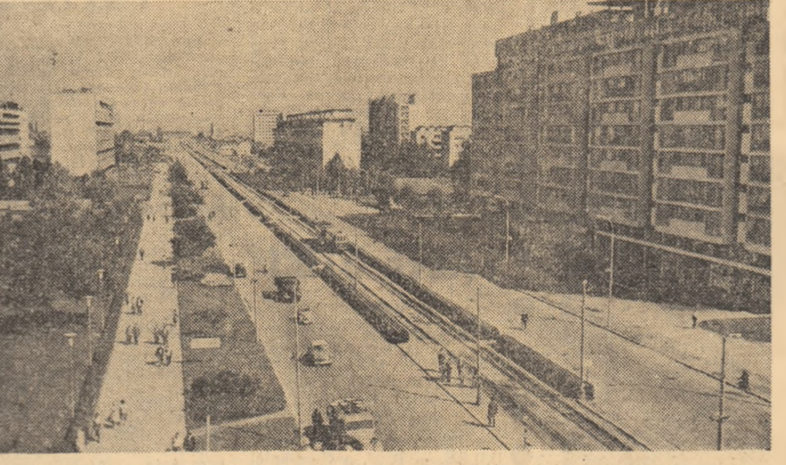
R. S. F. IUGOSLAVIA. — Vedere din Zagreb