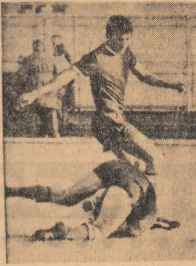
Neagu atacă insistent, dar sportiv.