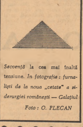
Secoană la cea mai înaltă tensiune. În fotografia: furna- lăști de la noua „cetate” a siderurgiei românești — Galațiul