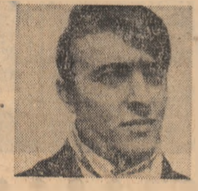
Mihail Spiridonescu și oceane...” fragment care se pretează admirabil și la o interpretare coregrafică. Bineînțeles, la barul pe care îl veți „deschide” pe scena serilor „Scintei tinerețului” vom dansa și cîteva dansuri moderne.

lui Mihail Sebastian în care se află un fragment de o grăitoare frumusețe: „... Sint seri cînd tot cerul fosnește de viață, cînd pe ultima stea, dacă ascuți bine, auzi cum fremătă păduri