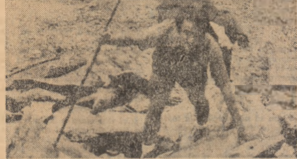
Película foto-amatorilor GHEORGHE DRĂGULESCU „Drum de munte”