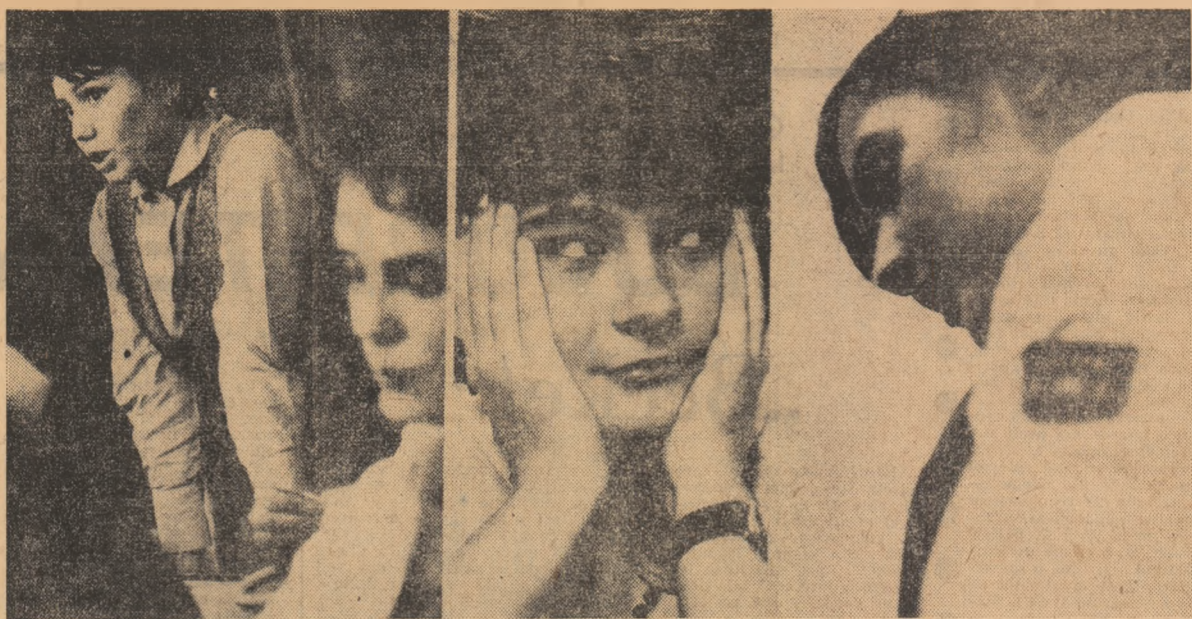
Trei imagini elocvente pe care fotoreporterul nostru le-a surprins în timpul desfășurării adunărilor de dare de seamă și alegeri ale organizațiilor de la anul II al Facultății de chimie și de la clasa a X-a A din liceul „George Șincai”