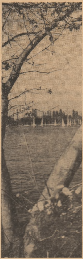
Pastel de toamnă în Herăstru