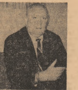
INTERVIU CU PROF. DR. ROBERT WHITE, din S.U.A.

celulei nervoase: oxigen, glucoză, aminoacizi. Se pot determina de asemenea, produsii metabolizării cerebrale. În sfîrșit creierul izolat poate furniza informații despre ceea ce mai predăsoare asupra influenței pe care o produce scăderea temperaturii. Pînă nu de mult se credea că sub o temperatură de 0 grade, metabolismul creierului încetează. Această pre-