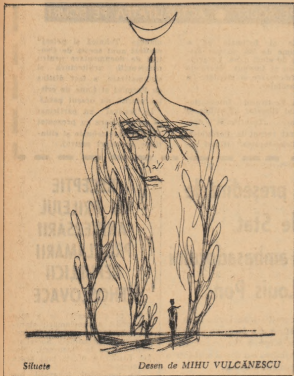
Siluetă Desen de MIHU VULCANESCU