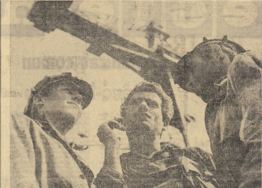
Scurtă „consfătuire” după efortul depus în timpul zilei

tetului Central al Partidului Comunist Român și guvernul Republicii Socialiste România își exprimă convingerea că aniversarea actului unirii de la 1 decembrie 1918 va mobiliza și mai mult energiile poporului nostru în activitatea constructivă pentru înfăptuirea hotărârilor Congresului al IX-lea și ale Conferinței Naționale, a politici marxist-leniniste a partidului nostru de desăvârșire a construcției socialiste, de ridicare a nivelului de trai al oamenilor muncii și de înflorire a Republicii Socialiste România, sporind astfel contribuția națiunii noastre la victoria cauză socialismului, păcii și progresului social în întreaga lume.