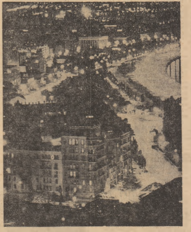
U.R.S.S. Nocturnă la Baku