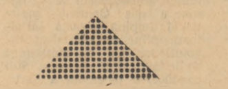
Postul Radu Rosetti