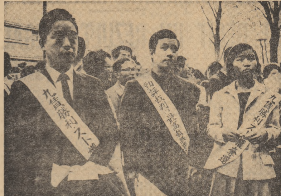
JAPONIA. Recent pe străzile orașului Tokio au avut loc mari manifestații ale muncitorilor în sprijinul revendicărilor lor economice și politice. În fotografie, aspect de la o asemenea manifestație

Cu aceste două cutremure, numărul mișcărilor seismice înregistrate în zona orașului Skopje de la 28 iulie 1963, cînd s-a