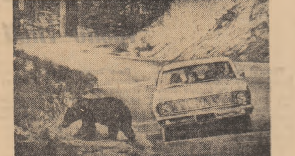
În parcul Yosemite, din Arizona, animalele, mai mult sau mai puțin sălbatice trăiesc libere, într-o imensă rezervație naturală. Accesul în perimetrul parcului este permis numai la cal.

acum din Republica Federală a Germaniei a fost descoperită la Dusseldorf. Aici clientul poate alege între tocniță de elefant, friptură de tigru sau mîncă-care ca întregă vechi de sarpe cu clopoșci, afară doar dacă preferă carnea artificială. Cine nu dispune însă de un portmoneu prea plin ar trebui să se mulțumească cu nu mai puțin atrăgătorii viermi de mîstăse, cu viermii cactusului mexican sau cu