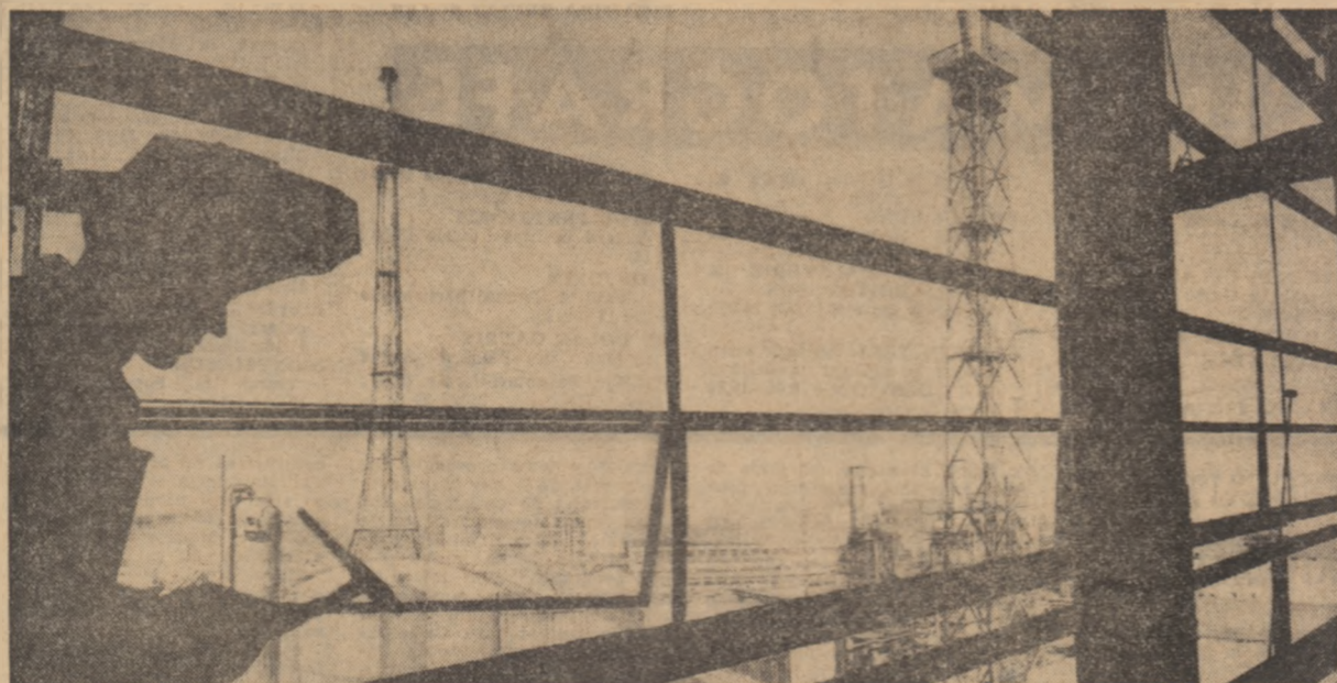
Imagine de la Combinatul de îngrășăminte azotoase Turnu-Măgurele