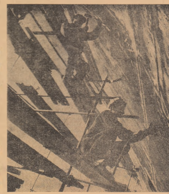
Uzinele mecanice Turnu Severin. Un nou cas de mare tonaj se află în stadiu de finalizare.