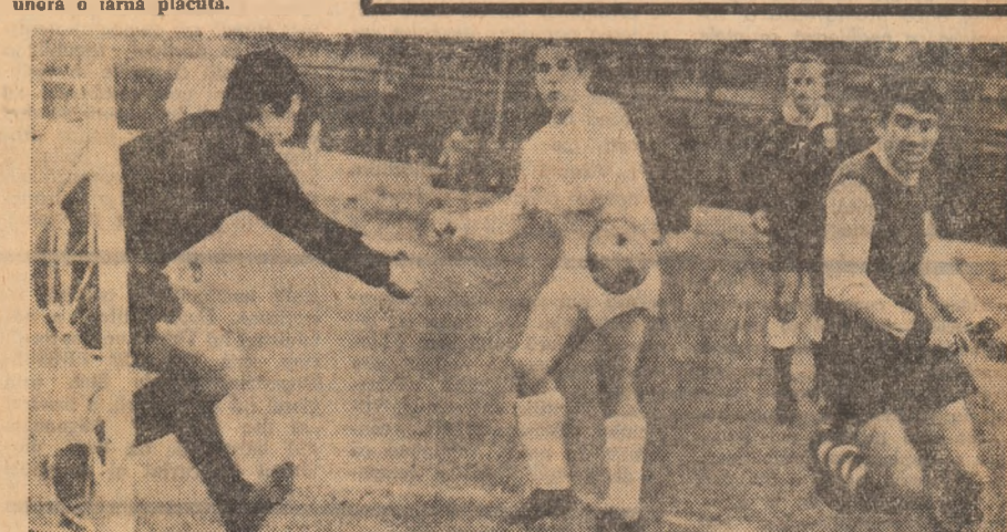
Disputa pentru balon la poarta bacoanilor