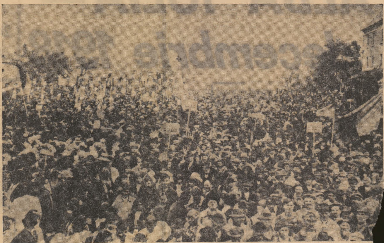
Alba Iulia, 1 decembrie 1918

naționalităților din Transilvania, ca urmare a luptei lor comune, în acțiunile a peste 100.000 de oameni reușii pe Plataul Romanilor din Alba-Iulia într-o impresionantă Adunare Națională.