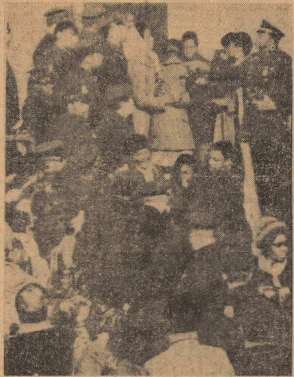
S.U.A. — Incidente în fața unei școli din Brooklyn în timpul grevei profesorilor new-yorkezi