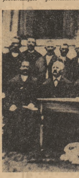
Garda Națională Română din Agrigbiu

solidari cu toți frații noștri, de orice neam ar fi ei. De aceea, cînd aderăm la Unirea românilor, vrem totodată și posibilitatea de dezvoltare a tuturor muncitorilor, precum și democratizarea României”. Obiectivele reprezentanților proletariatului