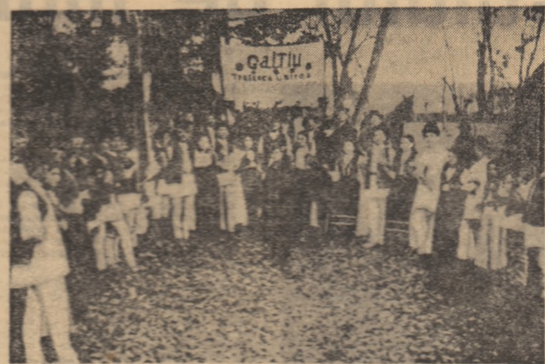
Delegația satului Galții la festivitățile de la Alba Iulia