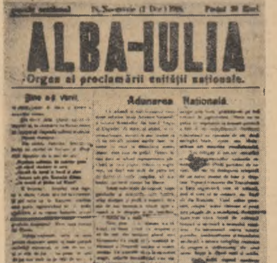
Facsimilul numărului ocazional al ziarului „Alba-Iulia” editat cu prilejul evenimentelor de la 1 decembrie 1918

mnos al străzilor pe care mulțimile au nălcut spre cetate și întîlnim un oraș întîinerit, cărta și s-au adăugat noi editicii și noi spații ale civilizației. Toate acestea sînt transformări materiale care se aselează pe care au antrenat mentalitățile oamenilor, constituie rezultatul cel mai concret al politicii partidului nostru, continuatorilor celor mai înalte tradiții de luptă ale poporului. Ele constituie o materializare a planurilor prin care țara întreațea — și oamenii ei — își îndreaptă vîrile spre un viitor luminos, ale cărui dimensiuni — bunăstare și progresul — se făuresc la toate nivelele de activitate și în toate compartimentele vieții noastre sociale. Idealurile luptătorilor din 1918 — moment important al luptei poporului pentru libertatea sa națională și socială — înglobînd o întreagă istorie a patriotismului poporului nostru, își află, azi, deplina lor împlîntire, pe care eroii actului de la 1 decembrie 1918 și urmașii lor sint fericii să o contemple. Iar fînția acestor idealuri, transmisă din mîină în mîină, ne luminează, deopotrivă, trecutul, prezentul și viitorul.