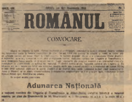
Textul „convocării” marii Adunări Naționale de la Alba Iulia, publicat la 21 noiembrie 1918