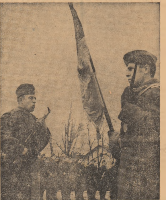
„Jur să fiu devotat patriei, poporului...”