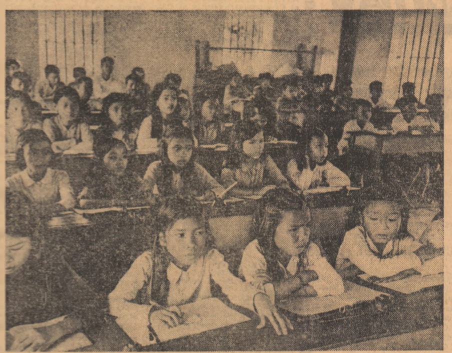
VIETNAMUL DE SUD. — Școala organizată într-una din regiunile eliberate de patrioți