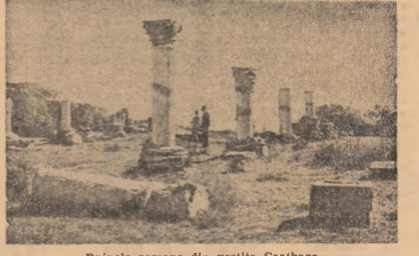
Ruinele romane din vestita Carthage.

a tinerilor pasionați de cinematograf din țările arabe și africane cu cinești din lumea întreagă, pentru a stabili un dialog lucid, o fraternitate artistică și o cooperare fructuoasă pentru țări. Neînțelegînd realizarea unei competiții palpitante și pline de surprize, întîlnirea la Tunis a prilejuit intr-oareva discuții înfăcșurate privind cinematograful ca reflectare a omului, a preocupărilor și aspirațiilor sale. Spectacolul cel mai interesant poate al întîlnirii l-au constituit dezbaterile care aveau loc zilnic în sala de conferințe a Hilton-ului, între realizatori și ziaristi din toate țările. S-au purtat discuții animate, pătimăse, pline de pasiune pentru cinema, alif, ca mod de expresie și ca instrument de comunicare. Încrederea vădită în capacitățile acestor noi aventurieri a spăritului, care este cea de-a 7-a ediție, de a exprima realitățile vieții și de a face cunoscute aspirațiile și modul specific de viață din țările lor, constituie o adevărată profesiune de credință. Peste 10 țări participante în