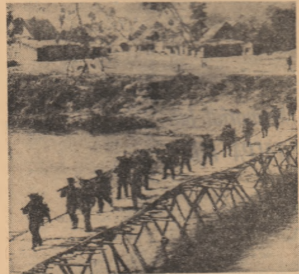
Un grup de patrioți sud-vietnamezi în misiune de luptă.