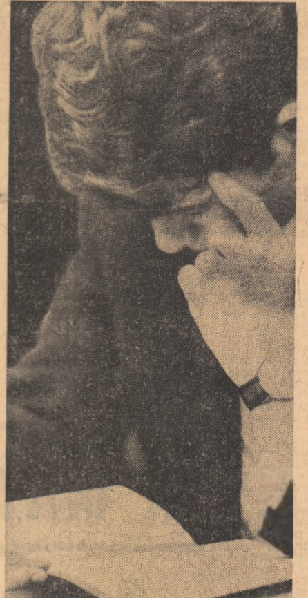
Se apropie examenele...