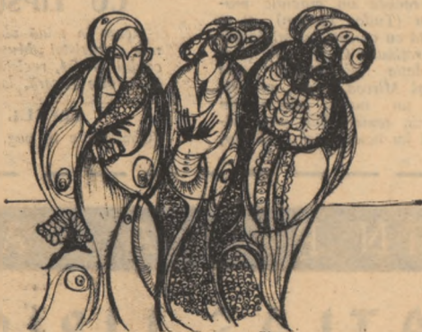
Ilustrație la „Ciocoi vechi și noi” de Nicolae Zenof (Școala tehnică de arhitectură)

Nu, arta scrisului nu e amatorism. Și bunicuțele noastre pictau trandafiri ori mingiaiu clopele clavecinului pentru satisfacția personală și bucuria familiei, dar înțelepturile lor nu le considera nimeni altceva decît o ocazie de destindere fericită. Sînt convins că acei dintre tinerii mei prieteni care au renunțat să meargă pe calea indicată de însușirile lor — mîngîindu-se cu gîndul că vor face literatură ca amatori — s-au dovedit lipsiți de curajul de a alege. Nu sînt un scriitor renumit și prestigiul statutului pe care-l dau elevilor talentați din cenaclurile de azi, nu este deloc impresionant. Li rog, totuși, să se gîndească la faptul! că a scrie literatură nu este și nu poate fi o treabă subsidiară, că a releva prin imagini sensul istoric al mersului societății românești spre lumină nu e o „nobilă inutilitate”, ci un act demurgic care cere dăruire, perseverență, răbdare și, nu de puține ori, sacrificii.