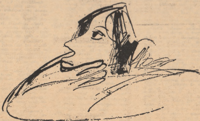
La școală — desen de Maia Damadian (Liceul „I. L. Caragiale”)