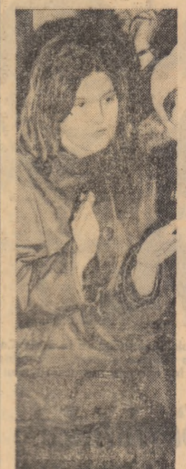
Ieri, în fata unui public tinăr și entuziast, care a umplut până la refuz sala...