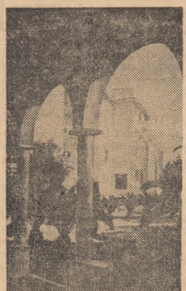
Constantine: arhitecturi monumentale, geometrice, replică la un peisaj torturat și înform

La 432 de kilometri de Alger, orașul Constantine — anticul Cirta roman — trăiește orgoliul discret de a fi a doua capitală a țării — resedinta „estatului algerian”, zonă cu personalitate distinctă și structură proprie de civilizație — și, poate, prima sa capitală spirituală. Peisajul e tulburător. Orașul călărăște o mîncă de piatră cenușiu-roșcată, înaltă sub oer de cîteva sute de metri. Casele se agăță de culmi ca căpușele, acoperisurile, văzute de jos, par că luncă lent spre abis. Undeva, la poalele mîncă de piatră, plutesc ireal apele Rhumelului, fum verde-albastru desirat printre cloștri de stînci care ard. Stîncile ard în soare în culori acide, desenele de pe pereții lor sînt niște desene fierbinți, viziuni delirante ale unei geologii torturate, ale cărei convulsii par încă proaspete. (și se pare că s-au oprît abia cu o clipă mai înainte. Piatra e o țiplă subțire, prin care vezi cum fierbe materia. Pe aceste stînci care ard, pasajele de păsări peste Mediterana se opresc într-o primă escală. Mille de rîndurile ce înnesesc podurile și pasarelele aruncate peste abisuri și femele care ies, în amurg, pe același poduri, cu fețele ascuse sub văluri negre, cu minciile negre și largi ale „haik”-urilor sfîșind ca niște aripi de păsări, gravurile din aurignacian și neolite descoperite în grotle Rhumelului, decînd pe pereții stîncioși siluete aeriene