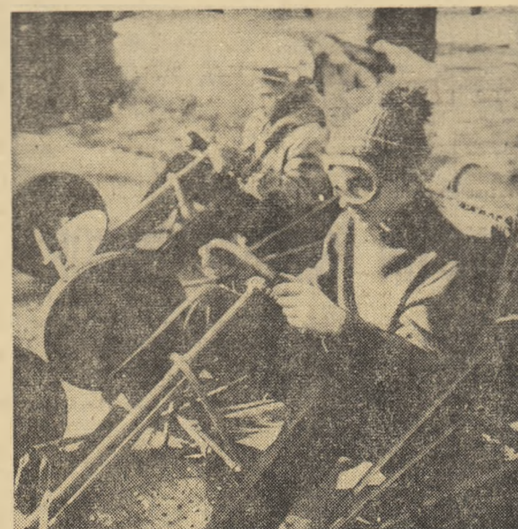
Un loc ce va fi mult căutat în timpul vacanței: pista de karturi

TUDOR VASILEU (Liceul „Mihail Viteazul”, București)