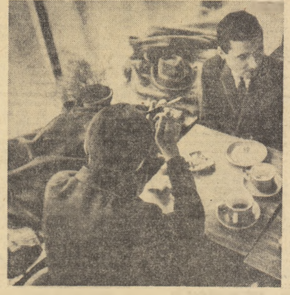
Recomandăm cafelele „Turist” de pe Bulevardul Magheru (oștii!), să achiziționeze câteva ciusere absolute necesare pentru căști și pahare, intrucît pentru paltoane și pălării există (după cum se vede în fotografiile) percazul vitrinei

în una din cele cinci secții: sculptură și artizanat, nava modelism, aeromodellism, oeliere, turism nautic. Cu prilejul înființării cercului, la Casa de cultură din localitate s-a deschis o expoziție de aeromodele, nava model și obiecte de sculptură realizate de membrii cercului. AUREL CAMPEAN