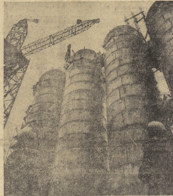
Coloanele gigantului siderurgic de la Galați