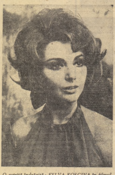
O actriță îndrăgită: SYLVA KOSCINA în filmul șechi: „Made in Italy”