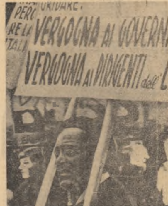
ITALIA. Aspect din timpul unei demonstrații revendicative a minerilor din San Giovanni Valdarno.

este de 200 de ori mai puternic decît cel al rachetei care l-a plasat pe orbită pe cosmonautul John Glenn, la 21 februarie 1962. Printre celelalte momente periculoase, specialistul american a menționat: plasarea navei pe o orbită lunară, la 128 km de Lună, în ziua de 24 decembrie, modificarea orbitei navei cosmice în timp ce se va afla la 100 km de Lună, „traectoria liberă” prin care navea va zăvui deasupra Pămînt și momentul întoarcerii în atmosferă.