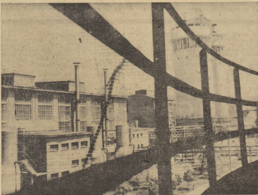
Vedere parțială a Combinatului de îngrășăminte azotoase de la Roznov