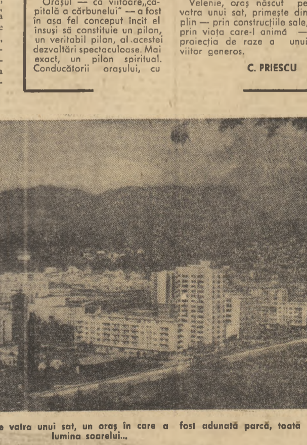
„Velenie, un oraș născut pe vatra unui sat, un oraș în care a fost adunată parcă, toată lumina soarelui...”