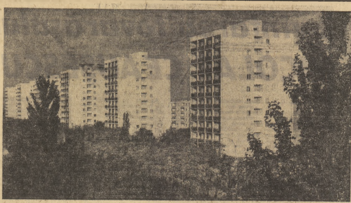
Vedere din Buzău: microscopul Cring