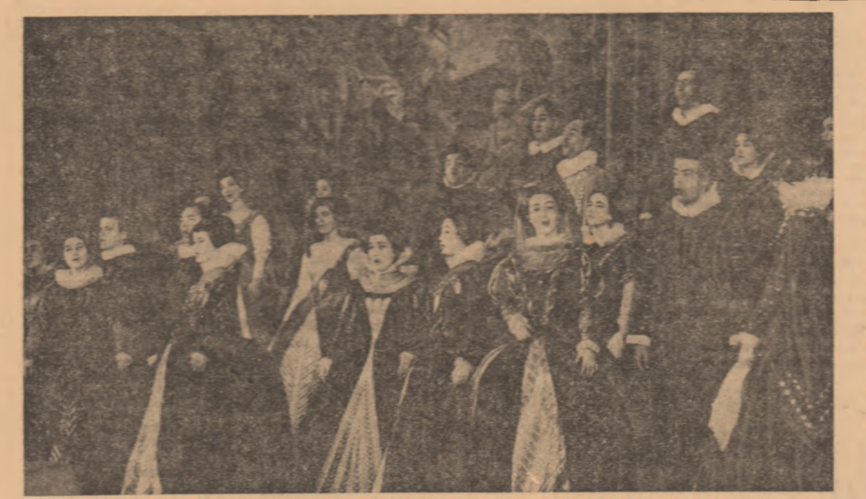
Corul Madrigal — un strălucit ambasador al muzicii noastre corale

BECKET rulează la Patria (orele 18; 19.30; 20.30). AVENTURILE LUI TOM SAWYER rulează la Republica (orele 9.15; 11.45; 14; 16.30; 18.45; 21); Festival (orele 8.45; 11.15; 13.45; 16.15; 18.45; 21.15); Me- lodia (orele 9.45; 12.15; 15.15; 17.45; 20.15); Feroviar (ore- rele 8.15; 10.45; 13.15; 15.45; 18.15; 21); Excelsior (la orele 9 AVENTURILE LUI TOM SAWYER și MOARTEA LUI JOE INDIANUL (ambale seri), PROFESIONISTI (orele 14.30; 17; 19.45). ASTĂ SEARĂ MĂ DISTREZ rulează la Luceafărul (orele 9; 11.15; 13.30; 16; 18.30; 20.45) In completare: Mai tare ca pînă. București (orele 8.30; 11; 13.30; 16; 18.30; 21 In com- pletare A 3-a Constantin). URLETUL LUPILOR rulează la Capitol (orele 8.30; 10.45; 13.30; 16; 20.30). Gloria (la orele 9 AVENTURILE LUI TOM SAWYER și MOARTEA LUI JOE INDIANUL (ambale seri), orele 13.30; 16; 18.15; 20.30). Modern (orele 9.30; 11.45; 14.15; 16.30; 18.45; 21. In