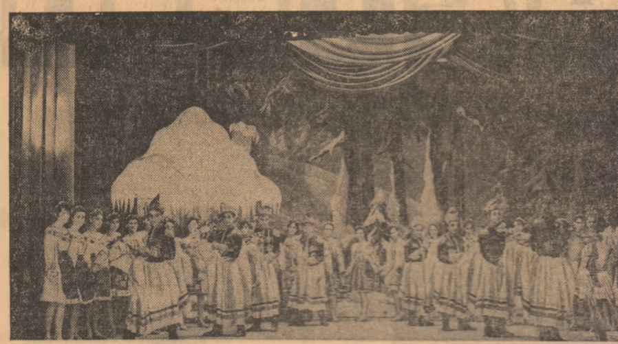
In taca de iarnă, pionierii și școlarii bucureșteni petrec zile pline de colozie la Palatul Pionierilor, Spectacolele pregătite de ei figurează ca de obicei în programul cazăcării