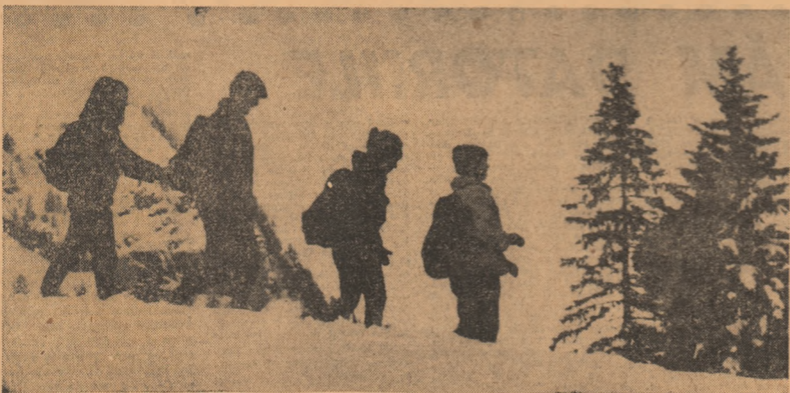
În vacanță, spulberînd omătul imaculat al munților