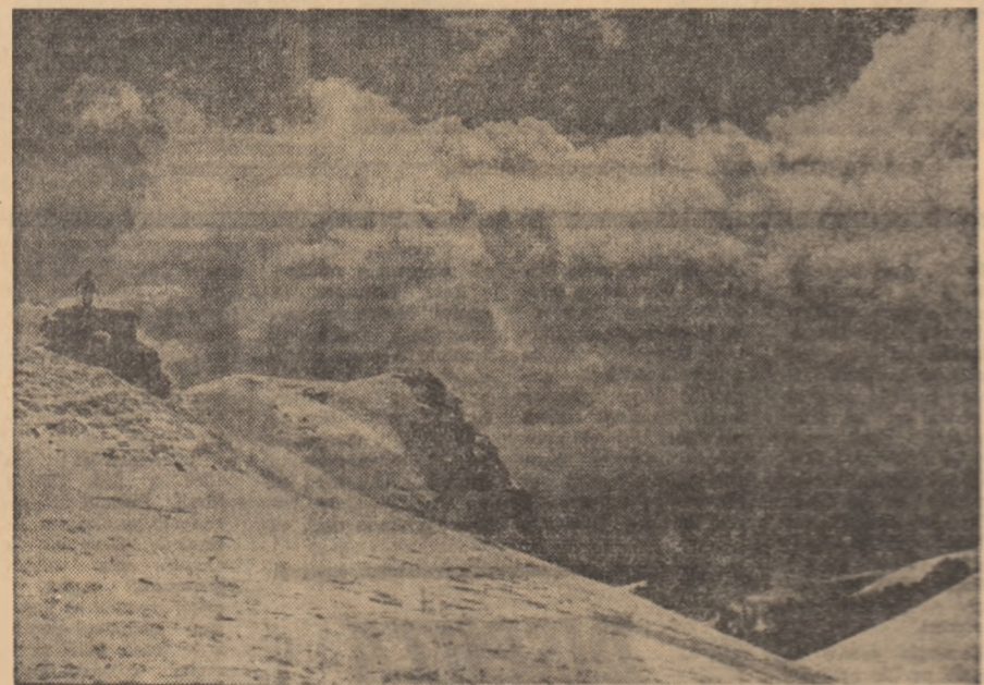
Spre „Virgul ou Dor”

ELEVI de la învățămîntul seral și fără frecvență precum și alți solicitanți DIN MEDIUL RURAL își pot procura manualele școlare de cultură generală pentru clasele I - XII, prin poștă, contra ramburs, adresându-se la LIBRĂRIA „CARTEA PRIN POȘTĂ” a cooperărilor de consum din București - str. Serg. Nuțu Ion 8-12, sectorul 6.