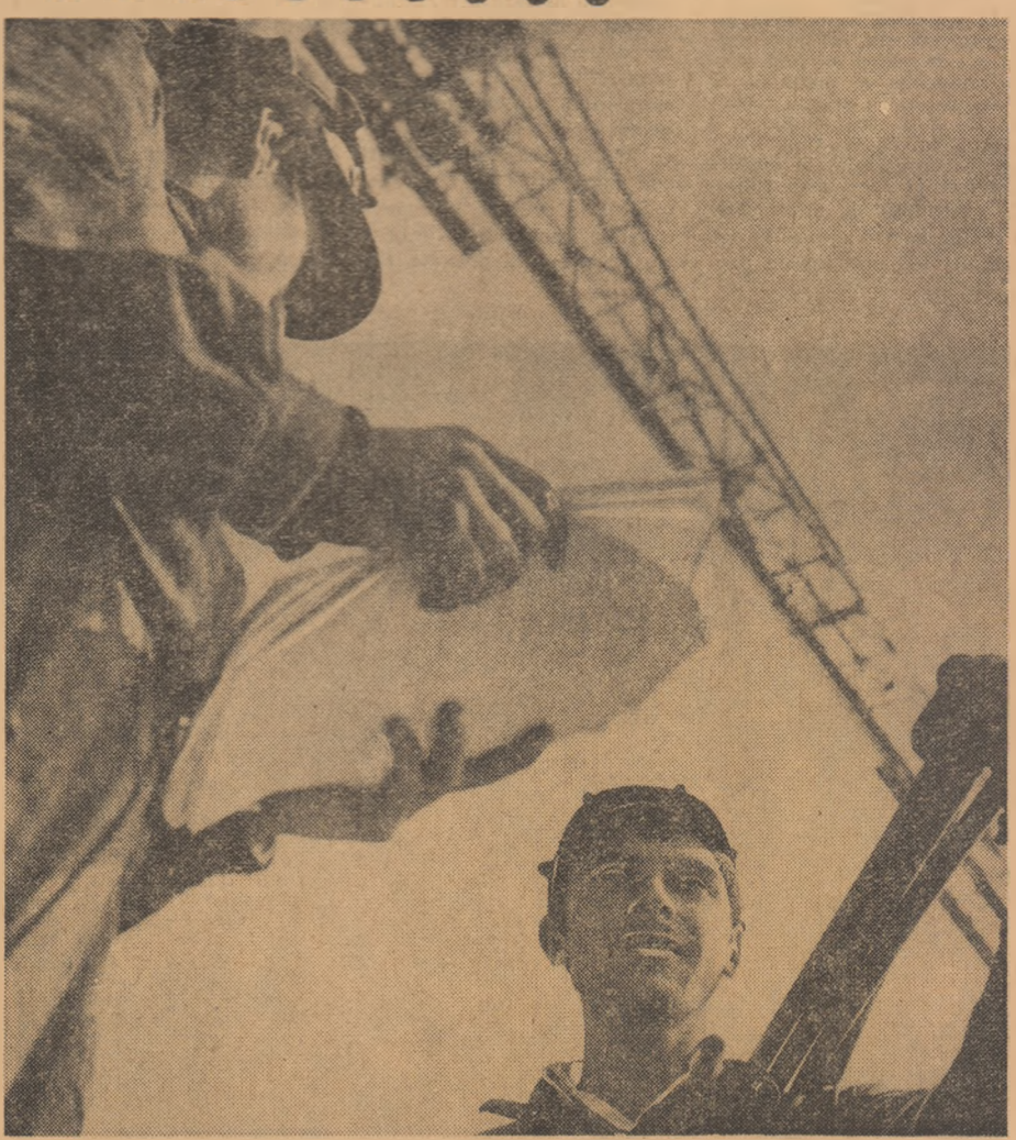
Pe șantier, la începerea programului