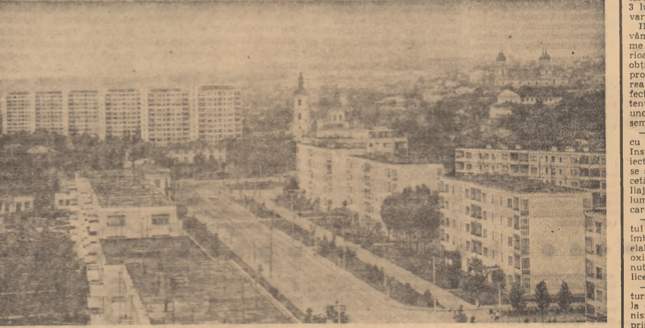
Iași în „prag” de țară