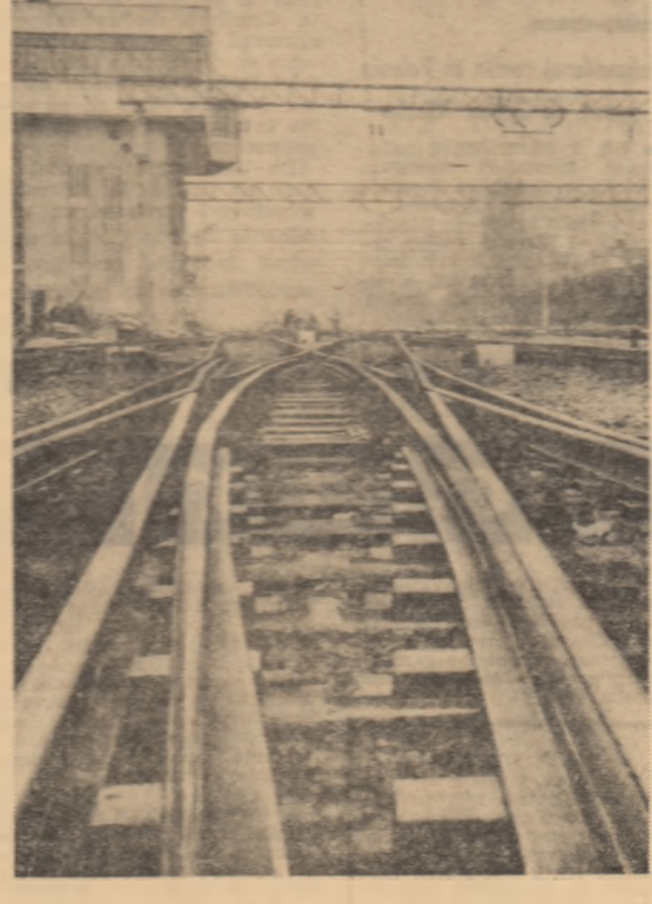
București, Casa de noapte în așteptarea primului tren electric.

THEODOR DREISER — Titanul (E.L.U., 17 lei). ••• Studii de muzicologie — vol. IV (Ed. muzicală, 31,50 lei). Ministirena Gavra — (Ed. Meridiane, 5 lei). CRIZANTEMA JOJA : Studii de filozofie a științei (Ed. Acad., 6,75 lei). D. PRODAN : Iobăgia în Transilvania — sec. XVI — vol. III (Ed. Acad., 8,50 lei). ȘTEFAN DEDIU : Hepatite acute icterigene — confruntări clinico-morfologice — (Editura medicală, 18,50 lei). MIHAI TICAN ROMĂNO — La viață în Congo (Editura științifică, 13 lei). Acad. ȘTEFAN MILCU — Endocrinologie ginecologică — (Ed. Acad., 30 lei). MIRCEA SOARE — Aplicarea ecuațiilor cu diferențe finite la calculul plăcilor curbă subțiri (Ed. Acad., 35 lei).