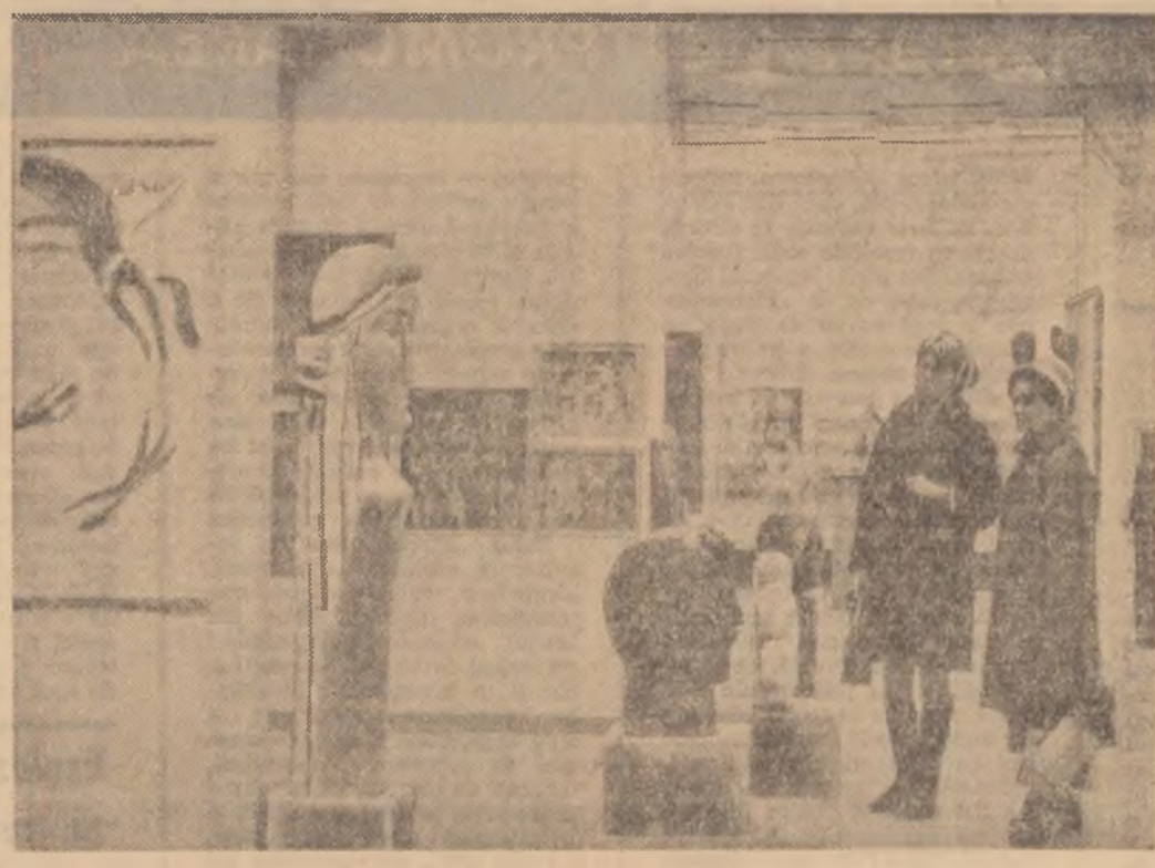
Aspect din „Expoziția biennială de pictură și sculptură '85”, găzduită în sala Dalles din Capitală

*) „Aventurile lui Tom Sawyer” și „Moartea lui Joe Indianul”.