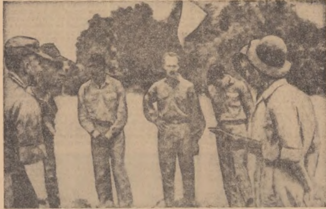
Frontul Național de eliberare din Vietnamul de sud a pus, zi lele trecute, în libertate trei prizonieri de război americani. În fotografie: momentul eliberării, la 60 de kilometri de Saigon. În stînga — delegații americani, în dreapta — delegații F.N.E.; la mijloc, prizonierii eliberați

La scurt timp de la desfășurarea a două mari demonstrații ale budiştilor militanți sud-vietnamezi, în favoarea soluționării pașnice a problemei vietnameze, o nouă manifestare de acest gen este în curs de organizare la Saigon, anunță FRANCE PRESSE. Unul din organizatorii acesteia, bonzul Phap Tri, a subliniat că și de această dată budiștii vor cere încetarea imediată a focului și retragerea trupelor americane. Este necesar, a spus el, ca problemele interne să fie reglementate de un guvern de uniune națională, care să reprezinte cu adevărat poporul vietnamez.