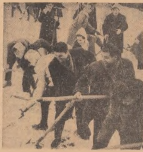
Nu vă uitați la cei din spate, care vor și ei să fie „prînși” de obiectivul fotografic. Au dreptul. Pînă acum au muncit cu spor

MIRCEA NICOLAE GH. NEAGU Nu vă uitați la cei din spate, care vor și ei să fie „prînși” de obiectivul fotografic. Au dreptul. Pînă acum au muncit cu spor