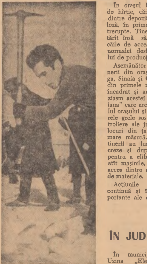
Sportivii se omoară... și la străduț.

Este absolut necesar ca mijloacele de transport al zăpezii să fie mai judicios folosite. Pe B-dul Magheru doi oameni încercău o mașină, pe strada Știrbei Vodă 7 mașini așteptau să fie încărcate de un autogreder, în timp ce elevii care lucrau pe strada Maria Rosetti, strîngeau zăpada la marginea trotuarului, urmînd ca apoi să o încarce în mașini. E bine să se ofere brigăzilor de tineret și mijloacele de transport necesare care să asigure muncii lor o eficiență sporită.