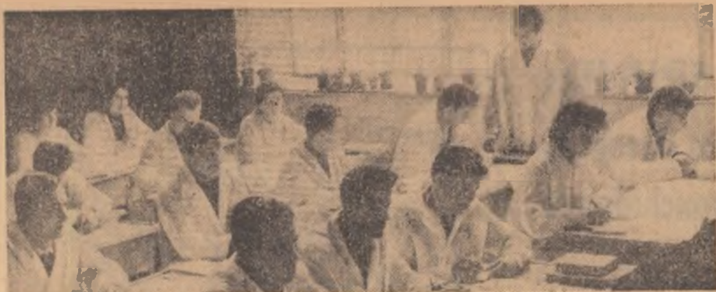
In laboratorul de botanică al Institutului agronomic din Cluj