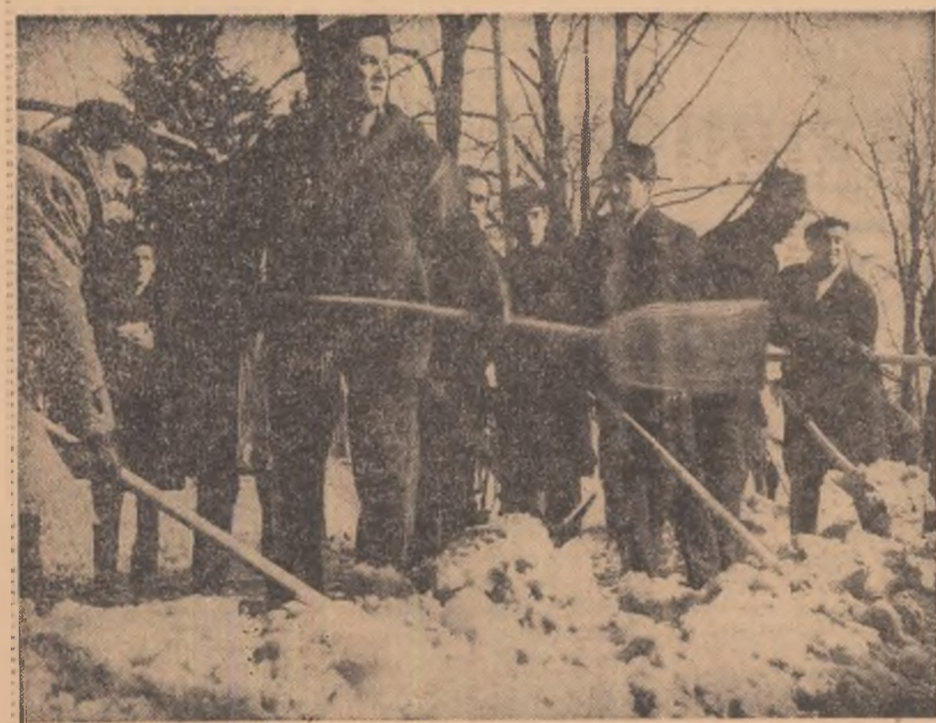
De la C.I.L. Pipera și Întreprinderea de piese radio și semiconductori au venit în centrul orașului să dea, o mână de ajutor