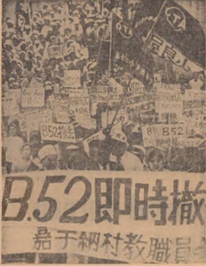
Demonstrație a populației din Okinawa împotriva bazelor militare americane

IN FRANȚA a fost inaugurată centrala nucleară „Saint Laurant des Eaux” de Loire. Operațiunile preliminare vor