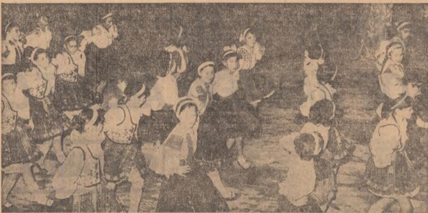
Echipa de dansuri a Școlii generale nr. 197 din Capitală