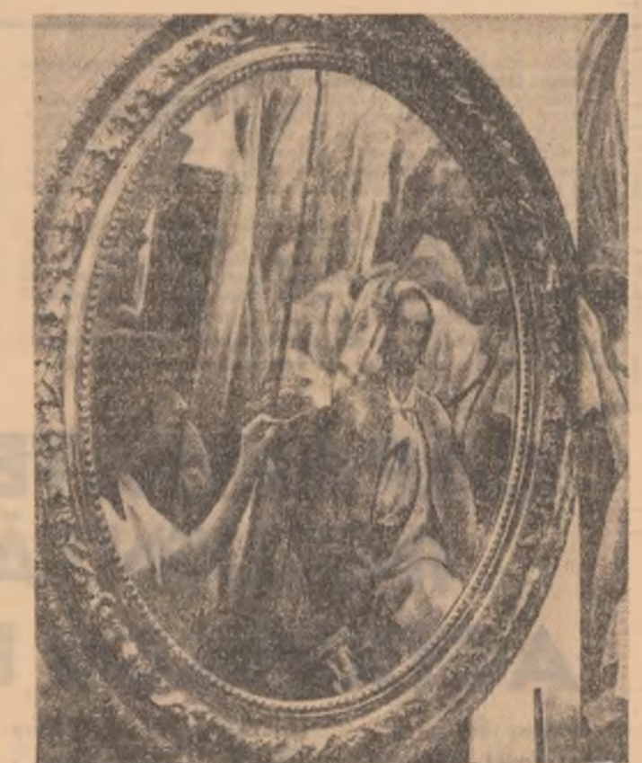
Prin atelierele secției de restaurare ale Muzeului de artă al Republicii Socialiste România