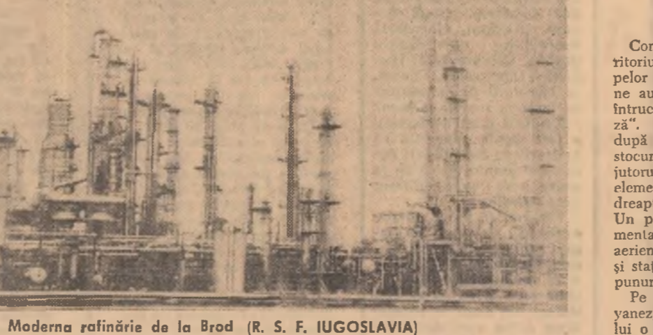
Moderna rafinărie de la Brod (R. S. F. IUGOSLAVIA)

În Cruzia, iarna din acest an se caracterizează prin puternice contraste meteorologice. În timp ce în orașele de pe malul mării înflorește cameliile și trandafirii, iar temperatura apei marine se menține la plus un grad, la Thilisi au căzut cantități neobișnuit de mari de zăpadă, iar gerurile au cunoscut valori pînă la minus 14 grade.