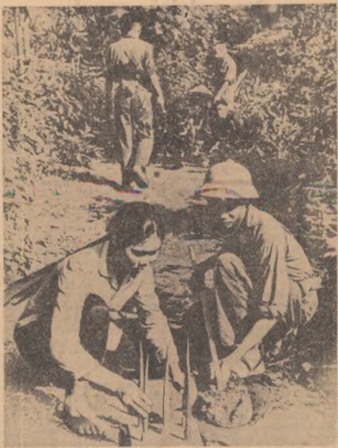
VIETNAMUL DE SUD. — Patrioți punând capcane în provincia Vinh Linh