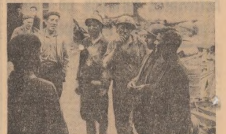
Mineri în grevă la Oviedo: „Record al grevelor”

expresiv tablou al represunilor. Deși aparent decapitată prin arestarea unui mare număr de conducători, mișcarea sindicală ilegală, constituită în jurul comitetelor muncitorești, s-a manifestat în continuare, cum aprecia ministrul de interne spaniol într-un interviu acordat cotidianului A.B.C. „ca o redutabilă mișcare de contestare și opoziție”. Ea este descentralizată și are atît de profunde rădăcini în masele muncitorești încît acționează și în împrejurări cînd aproape întreaga conducere centrală și regională a fost depistată și încercată. Au continuat să funcționeze comitete de coordonare pe ramuri industriale și s-a reușit chiar organizarea, în noile mure ale unei conferințe a reprezentanților comitetelor muncitorești din întreprinderile metalurgice. Evident o asemenea vitalitate în ciuda presiunilor permanente și masive nu ar fi posibilă fără o largă solidarizare, nu numai a purtătorilor muncitorești ci și a unor cercuri progresiste spaniole. E semnificativ, de pildă, că printr-un proceseale răsunătoare de anul