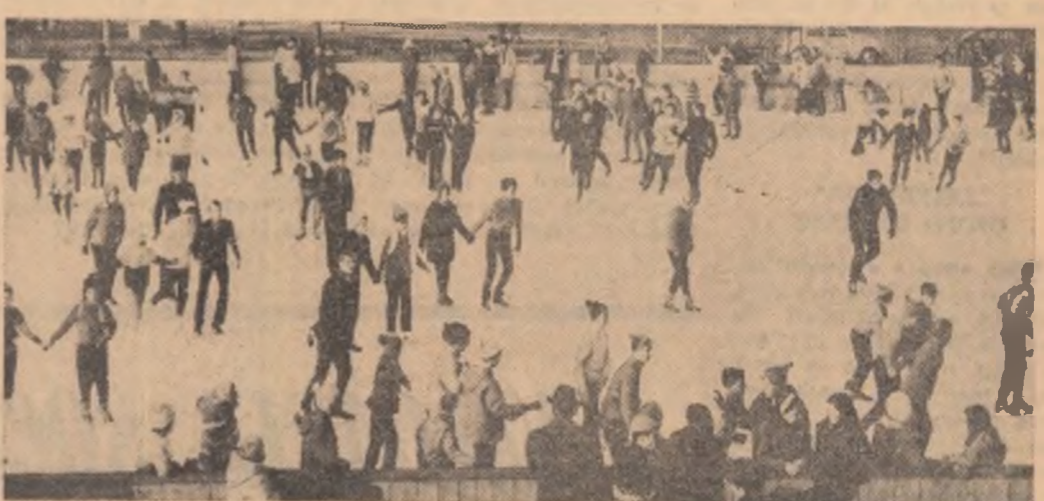
În aceste zile de vacanță, pe Patinoarul Floreasca

● Preocupări pentru îndrumarea tinerilor spre exploatarea miniere, șantierele de construcții și unitățile de transport ● Lucrări în silvicultură în valoare de 150 000 lei ● O mie de tineri vor participa și în acest an la construirea șoselei naționale Baia Sprie — Sighet — Vișeu.