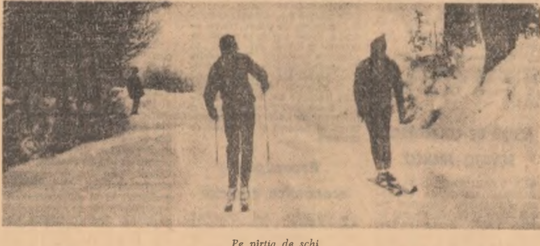
Pe pîrtia de schi

La federația noastră de box s-a primit înscrierea oficială a echipei Angliei la campionatele europene care vor avea loc între 31 mai și 7 iunie la București. Pînă în prezent la această ediție a competiției și-au anunțat participarea 26 de țări.