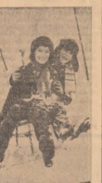
Din bucuriile vacanței

În prima parte a lunii februarie, la Brașov, și-au dat întâlnire 90 de tineri cîștigători ai Olimpiadei strungarilor desfășurată la nivelul județelor. La Uzina de autocoană, locul de desfășurare a Olimpiadei tinerilor strungari, ajunsă în faza finală, organizată de C.C. al U.T.C. în colaborare cu U.G.S.R. și M.I.C.M., tinerii veniți din diferite întreprinderi ale țării vor avea prilejul să-și etaleze cunoștințele de specialitate măiestria profesională. Etapele premergătoare întrecerilor de la Brașov, dotată cu trofeul „Strungul de aur” — rezervat fîrește celui mai bine pregătit dintre concurenți — au angajat în competiție a-proape 30.000 de tineri, stimulați astfel să-și perfecționeze propria pregătire științifică și să pășească mai adînc în tainele acestei frumoase meserii. Aș dori să menționez că „Olimpiada strungarilor” și-a dovedit de-a lungul desfășurării sale din plin utilitatea și caracterul instructiv, cîștigîndu-și un loc principal între mijloacele utilizate de organizațiile U.T.C. pe linia stimulării la tineri, a pasiunii pentru profesia pe care și-au ales-o.