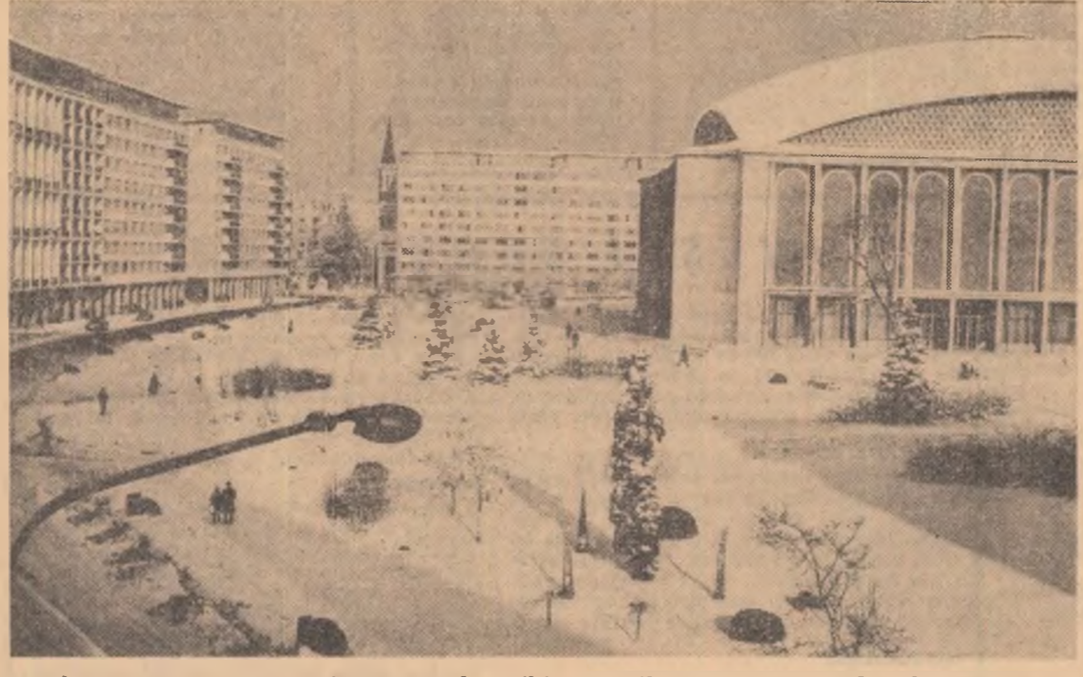
Miracolul zăpezii operează și în înfrățirea orașului modificării ce-i dau, pentru un timp, alte valențe. Orașul trece astfel prin iarnă, purificat, primenit, oferind și în felul acesta o amplă varietate a peisajului său

N. COȘOVEANU (Continuare în pag. a III-a)