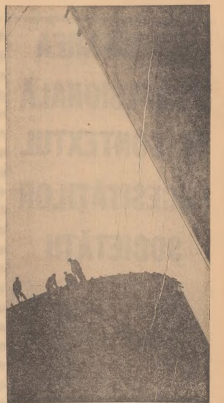
În zona industrială a Piteștiului constructorii au înălțat în ultimii ani un modern edificiu — Combinatul Petrochimic. În fotografie: siluetele gigantice ale rezervoarelor

O ipoteză de-a dreptul spectaculoasă a fost emisă recent, prin studiul substituirii otelului foarte consistent de la utilajul petrolier, cu fontă, în compoziția căreia se află grafit nodular. Ipoteza trebuia dovedită științific. Și laboratoarele au vorbit. Rezultatul: fonta îndeplinește toate condițiile mecanice, fiind cu mult super-