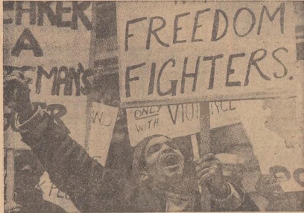
ANGLIA. — Demonstrație la Londra cu ocazia deschiderii conferinței Commonwealthului

În fapt, cea mai mare parte a sumei este destinată achiziționării din R.F. a Germaniei a unui număr de 65 de tancuri de tipul „Leopard”. Preocuparea opiniei publice față de aceste intenții poate fi înțeleasă întrucât cu puțin timp înainte în urmă guvernul de la Haga a comandat alte 400 de tancuri de același tip pentru necesitățile forțelor armate, la care s-au adăugat o serie de camioane destinate fotei