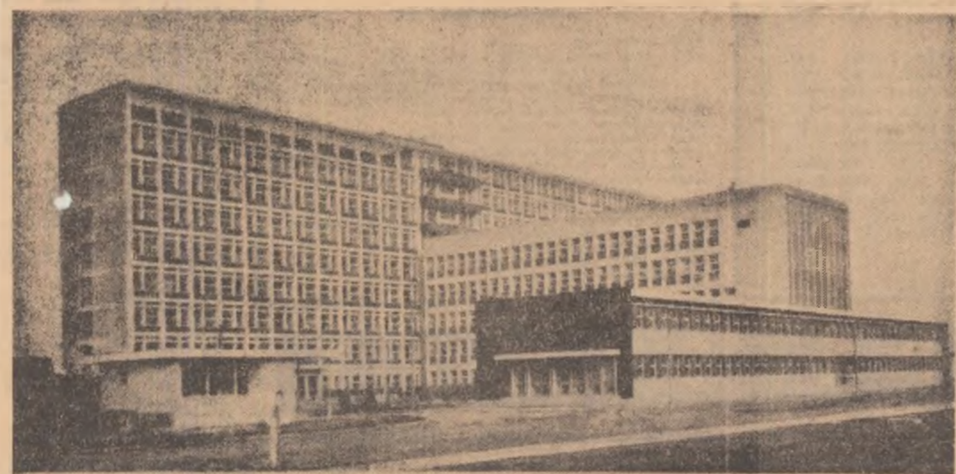
Vedere panoramică a noului spital din Sibiu