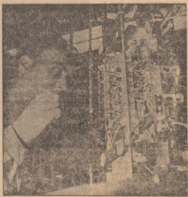
Întreprinderea "Electronica": se montează noi aparate de radio

DE CE DOAR PE HIBETI? În luna octombrie a anului trecut, în presa locală a apărut un anunț care ne-a dat speranțe. Afiam că Direcția comerțului Județean Otîr și O.C.L. mixt Bisericii Domnești, au început lucrările de construcție a unui nou hotel, cu o capacitate de 100 locuri. La parter se va afla un modern restaurant și o terasă. În aceeași clădire va funcționa agenția locală O.N.T. Noua construcție va purta amprenta arhitecturii locale populare, și la Pitești s-au atestat încăerările unui hotel turistic, cu 200 de locuri. (Subredacția Otîr).