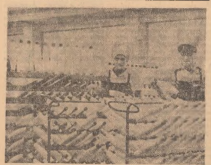
Uzina de fire și fibre sintetice Săvinești. Aspect din sectorul țesutii, atelierul de etirat fire

În anul 1969, fabrica de aparate electrice de înaltă tensiune are înscrise în planul de activitate sarcini sportive. Firesc, în acest context eforturile întregului colectiv - în care o pondere însemnată o dețin tinerii - trebuie să fie îndreptate în același sens, spre valorificarea integrală a acelor resurse care să permită continuarea drumului ascendent al autorității fabricii, menținut la înălțimea și prestigiul pe care-l impune numele Uzinei „Electroputere“.