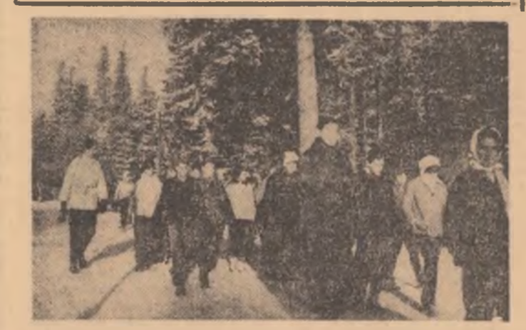
Teri, numeroase grupuri de tineri turiști au escaladat crestele alpine ale munților

ÎN NUMARUL DE ASTĂZI, ÎN PAGINA A II-A VĂ INFORMĂM DESPRE DESFĂȘURAREA CONFERINȚEI ORGANIZAȚIEI JUDEȚENE ILFOV A U.T.C.