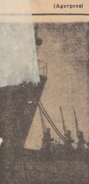
Car plumburi deasupra portului Constanța