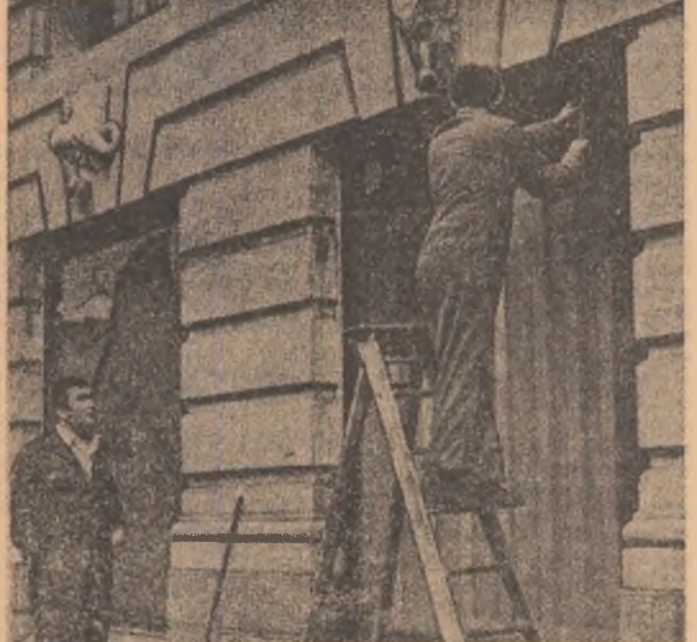
ANGLIA. Se restaurează fațada clădirii South Africa House din Londra unde au avut loc manifestații violente împotriva politicii Republicii Sud-Africane