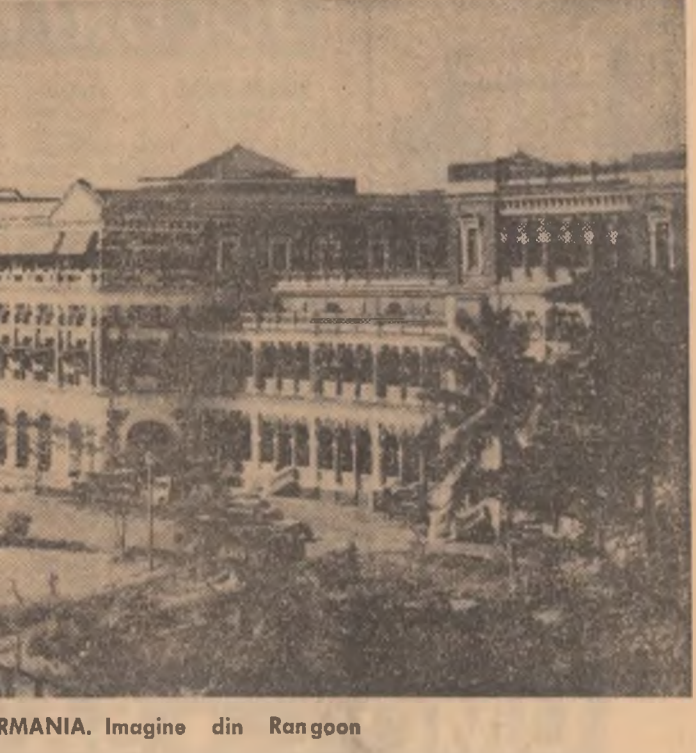
BIRMANIA. Imagine din Rangoon