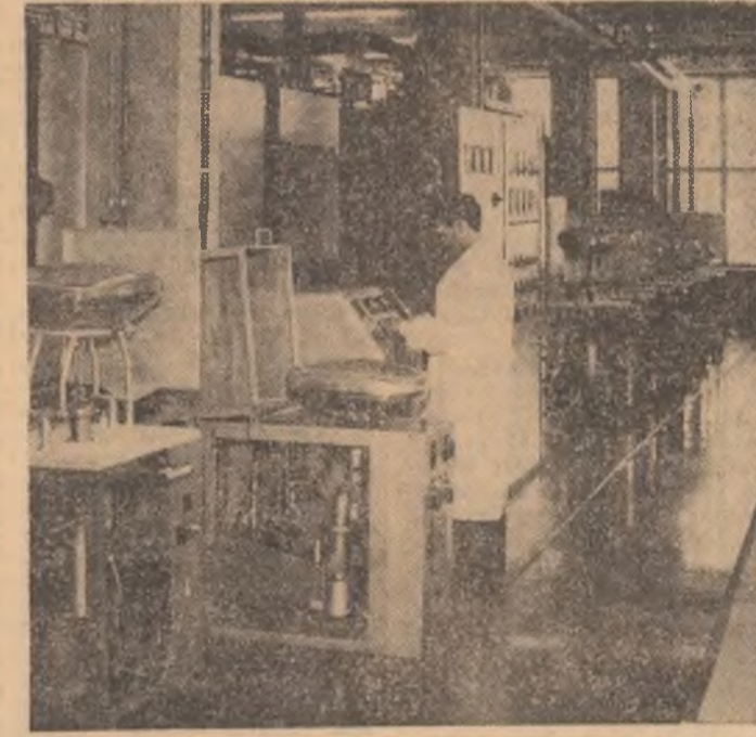
R. S. F. IUGOSLAVIA. La un institut specializat din Zagreb se cercetează rezistența și calitatea electroazelor