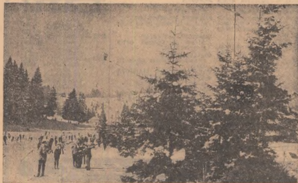
Pe pîrtia electrificată de la Poiana Brașov