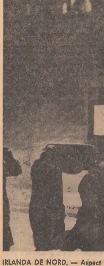
IRLANDA DE NORD. — Aspect din timpul recentelor incidente

Delegația sovietică la conferință a fost condusă de N. Blohin, președintele Institutului pentru relațiile sovieto-americane.