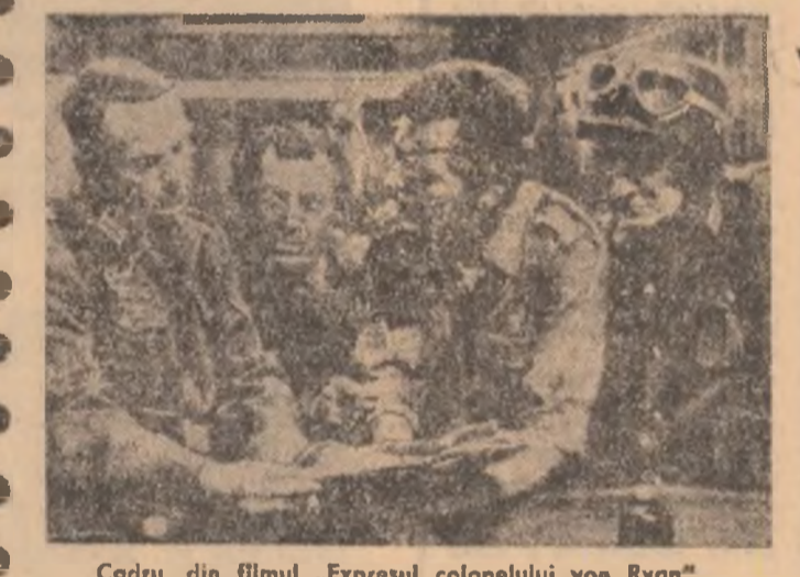
Cadru din filmul „Expresul colonelului von Ryan”

nul pleacă mai departe urmînd un trafic orar ce trebuia, pentru a nu trezi bănuieli, respectat cu exactitate. Trupurile împuşcaților rămîn îngrîsate terasamentul înșelate sub același priviri înspăimîntate ale sîtenilor, într-o postură de victime ale fascismului fără să știe nimeni, niciodată, că moartea lor era un act de dreptate și nu o fărîdeală de ocupanților hitleristi. Finalul filmului este înscris într-o conjunctură ce relie-