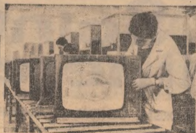
Marea uzinelor „Electronica” din Capitală își consolidează prestigiul cu fiecare nou receptor care iese de pe banda de montaj. Fabricate la un înalt nivel tehnic calitativ, produsele acestor uzine se bucură de o largă apreciere atât pe piața internă cât și la export. În imagine, secvența de la operația de probă a unui lot de televizoare „Miraj”.

INIȚIATIVE ALE ORGANIZAȚIILOR U. T. C. GORIENE