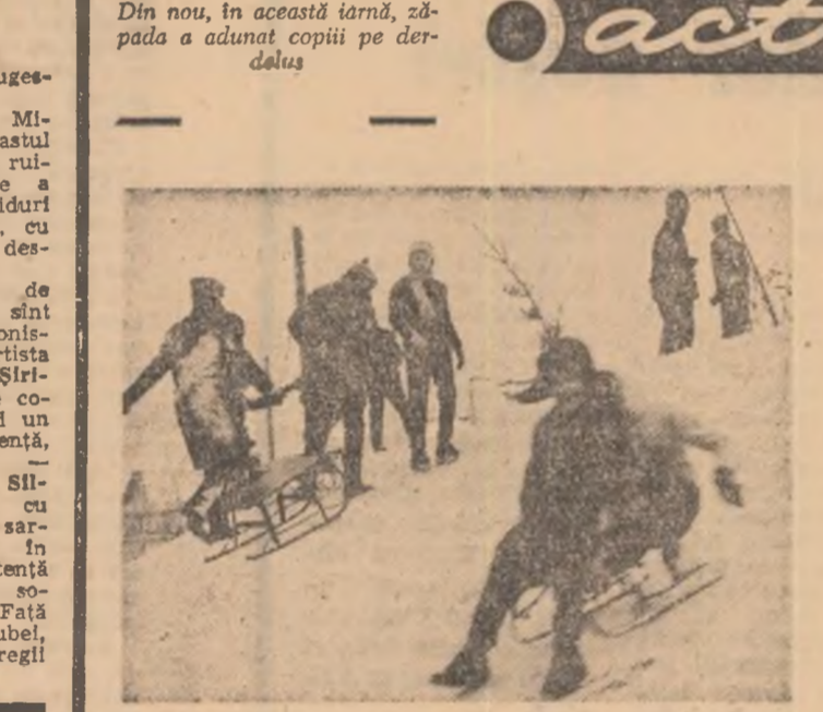
Din nou, în această iarnă, zăpada a adunat copiii pe derdeluș