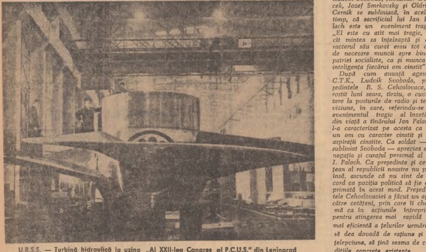
U.R.S.S. — Turbină hidroelectrică la uzina „Al XXI-lea Congres al P.C.U.S.” din Leningrad

Faptele arată că „integrarea” favorizează în mod unilateral țărilor mai puternice din cadrul grupurilor economice închise, chiar dacă în respectiva grupare fac parte numai țări dezvoltate din punct de vedere economic. Această concluzie, din ce în ce mai larg acceptată în Europa occidentală, se reflectă atît în literatura economică și în presa politică vest-europeană, cît și în declarațiile unor personalități politice ale țărilor membre ale Pieții Comune. Economiiștii analizează tot mai profund implicațiile de perspectivă ale „integrării” economice, conchizînd că avantajele obținute sînt considerabile mai mici decît imensele riscuri pe care le presupune contopirea economiilor naționale ale celor șase țări într-o unitate ce va duze în continuare mari monopoluri, creîndu-le condiții pentru acapararea mai facilă a pozițiilor în economia „internaționalizată” a Pieții Comune. Pe de altă parte, oamenii poli-