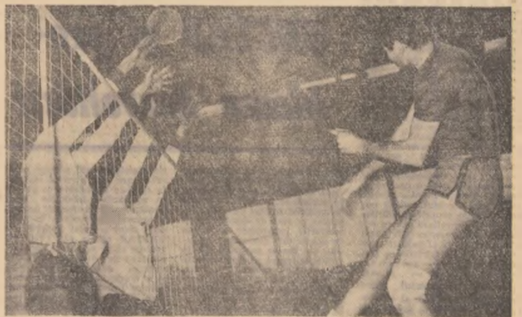
O faza la fileu din partida Steaua-U. S. C. Munster