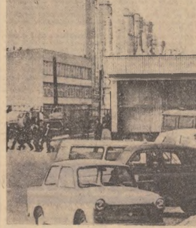
Intrarea Combinatului de îngrășăminte chimice azotoase de la Polawy

Dezvoltarea continuă a construcției socialiste în cele două țări, sporirea potențialului lor economic, au creat premise favorabile largirii și diversificării legăturilor dintre Republica Socialistă România și Republica Populară Polonă, pe baze reciproce avantajoase. În cadrul acestor legături un loc important revine schimburilor comerciale, re-