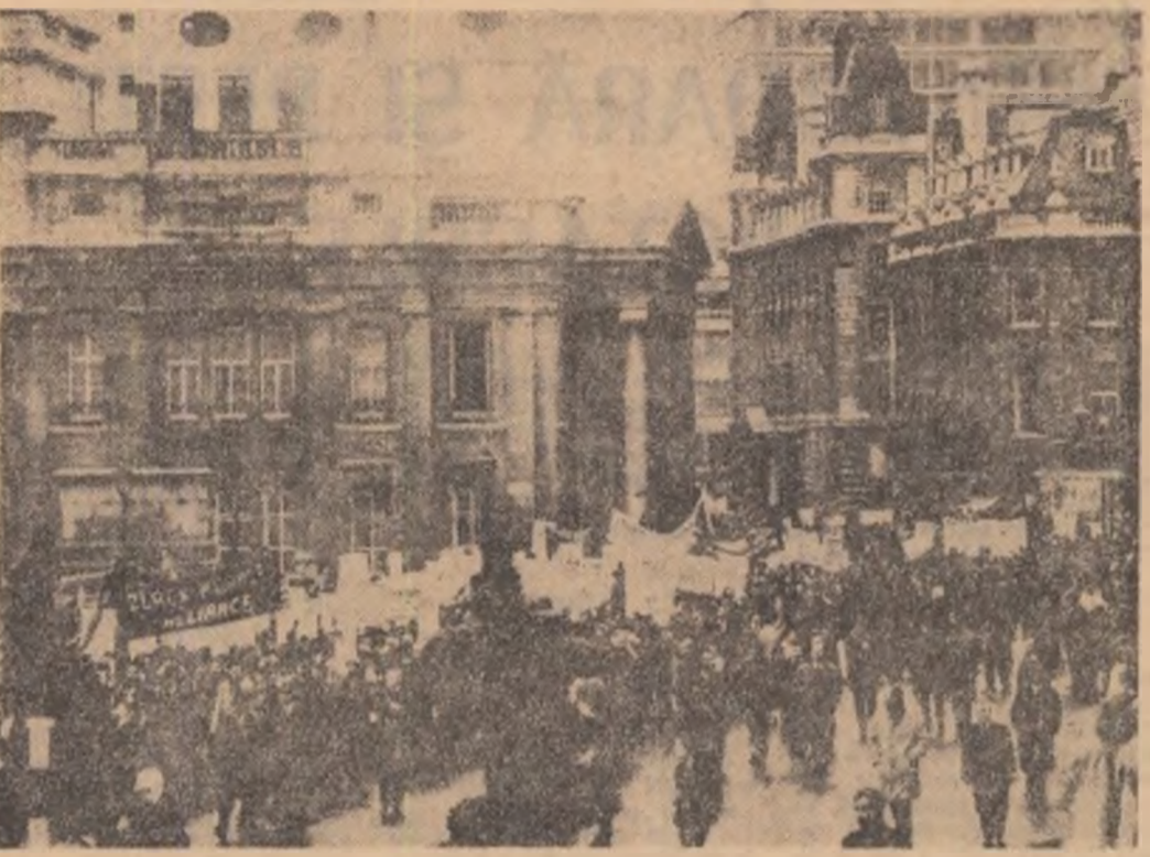
Demonstrația a populației de culoare la Londra