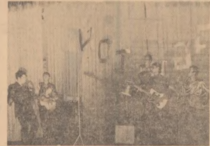
Ansamblul tineretului din Oradea