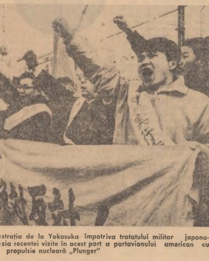
JAPONIA. Aspect de la demonstrația de la Yokosuka împotriva tratatului militar japono-american care a avut loc cu ocazia recentei vizite în acest port a portavionului american cu propulsie nucleară „Plunger”

În aceste situație se găsește însă și alte organisme ca E.L.D.O., E.S.R.O. și C.E.R.N. (din domeniul financiar), cercetării spațiale și nucleare comune) care nu mai suscită azi euforia primelor inițiative, fiecare țară căutînd să-și rezolve problemele mai degrabă prin acorduri bilaterale decît în bloc.