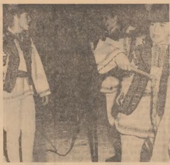
În țureșul dansului popular

Există însă, în ce privește relațiile cu cluburile sindicale sau casele de cultură ale sindicatelor