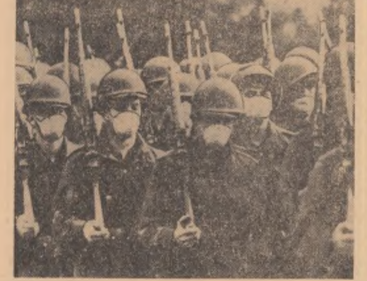
S.U.A. Recruții americani au primit mîști de protecție împotriva microbului gripei „Hong-Kong”

De la Londra, secretarul general al O.N.U., U.Thant, va pleca la Addis Abeba pentru a participa la reuniunea Comisiei Economice a O.N.U. pentru Africa.