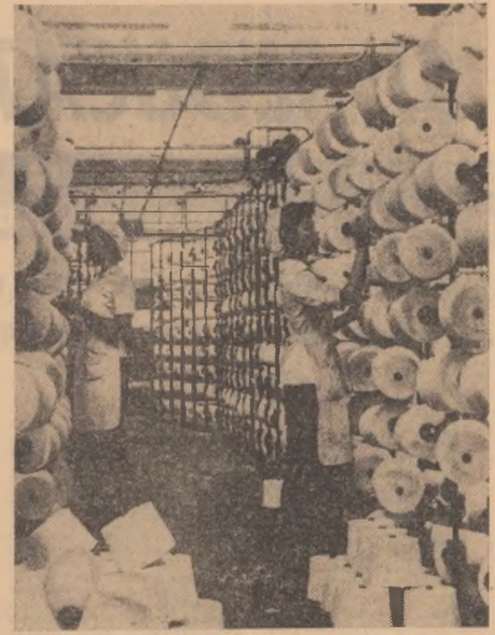
R. D. VIETNAM. La filatura Uzinelor textile „8 Martie” activitatea productivă se desfășoară într-un ritm susținut

arabo-israelian și joacă și Gunnar Jarring, trimisul special al Secretariatului general al O.N.U. în Orientul Apropiat. „Acesta, a spus Jakobson, se află deja la New York și așteaptă desfășurarea evenimentelor.