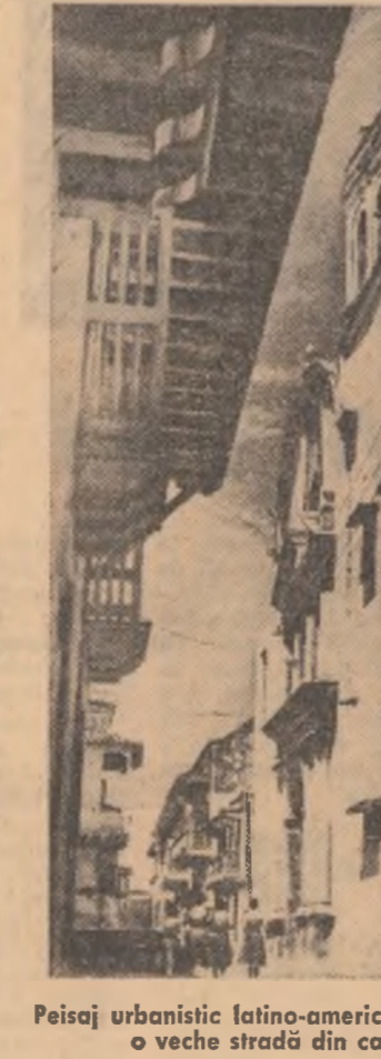
Peisaj urbanistic latino-american: construcții în stil spaniol pe o veche stradă din capitala peruviană — Lima