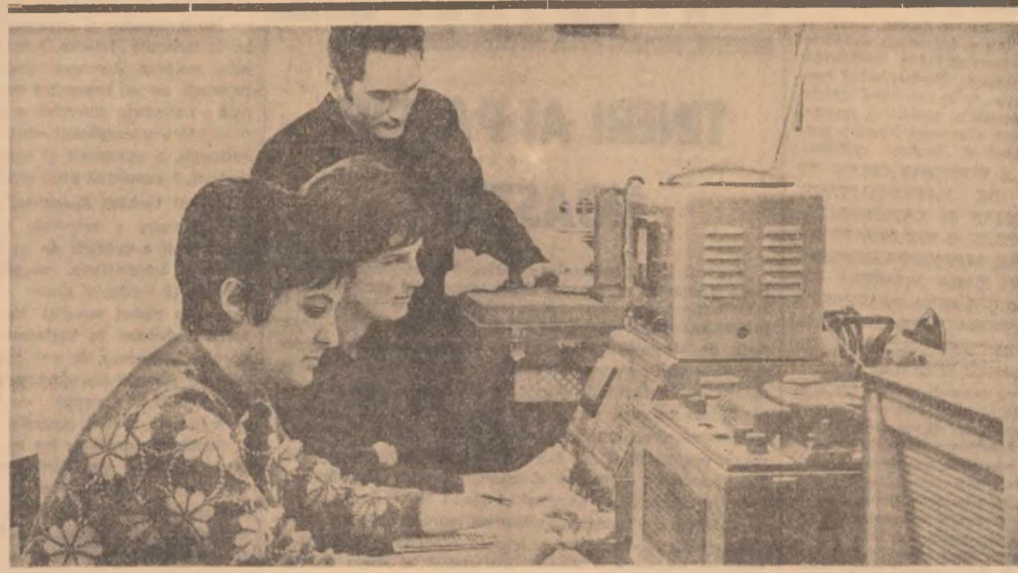
Institutul de cercetări fonetice și dialectale al Academiei. În laboratorul de fonetică un grup de cercetători studiază sunetele vorbite în sonograph.

prim rang a uteciștilor și implicat a organizației U.T.C. din școli. „Am constatat că cu cît crește conștiința politică a elevului cu atît mai conștient