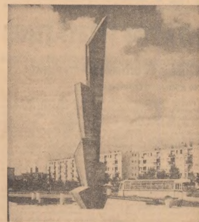
Din noul peisaj al orașului Galați — Cartierul Tiglina