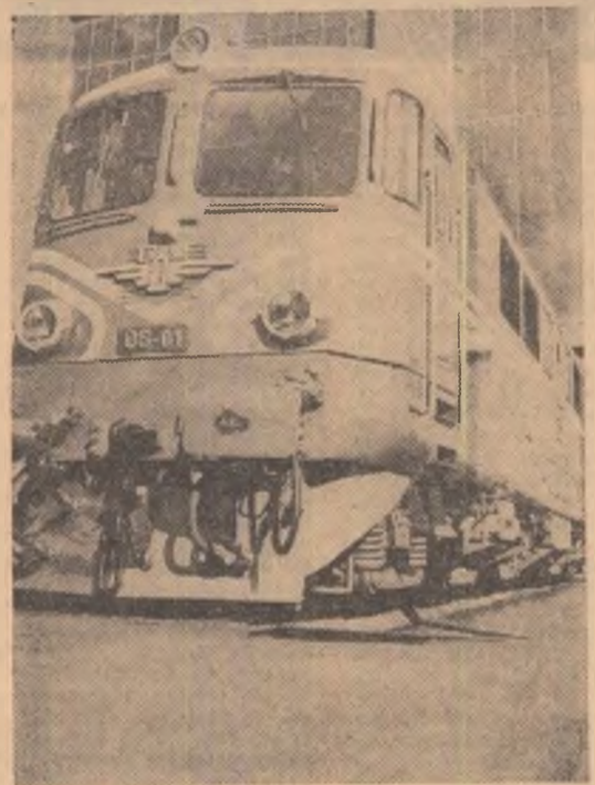
Locomotiva „Diesel” electrică, mindria constructorilor craioveni