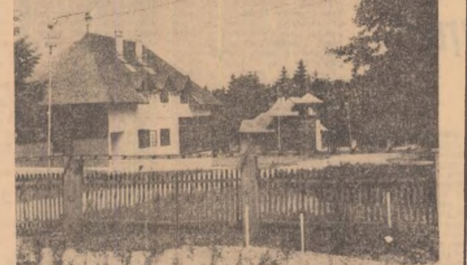
Imagine din stațiunea Soveja