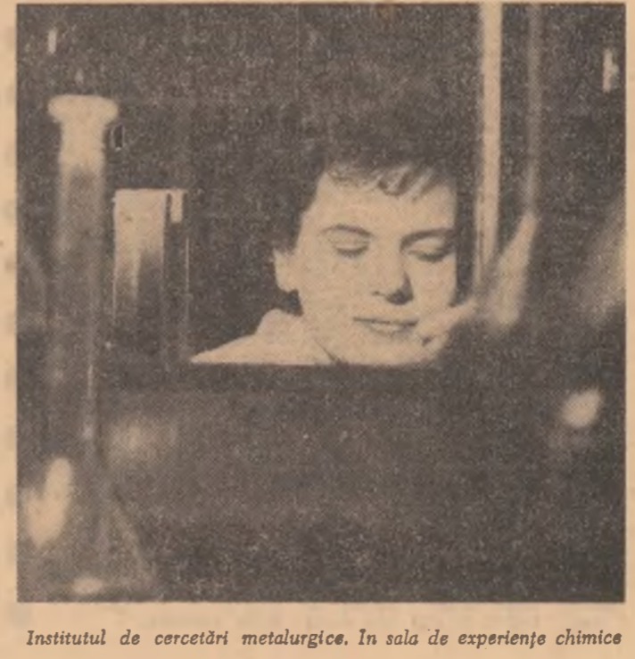
Institutul de cercetări metalurgice. În sala de experiențe chimice