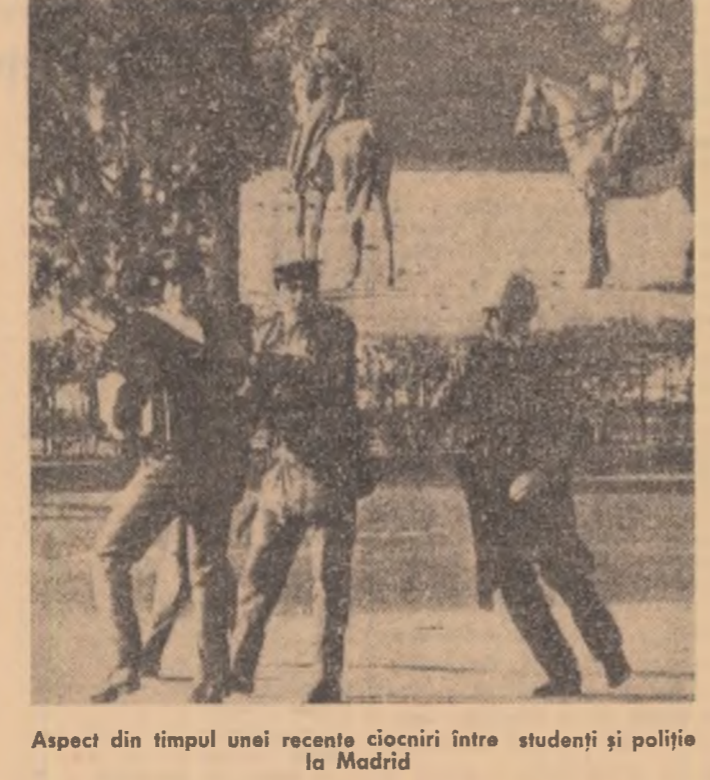
Aspect din timpul unei recente ciocniri între studenți și poliție la Madrid