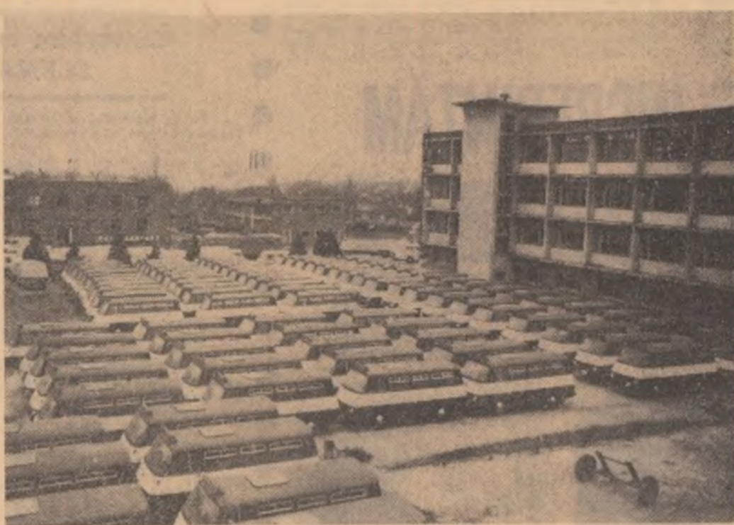
Uzina „Autobuzul“ din Capitală

Să refacem traiectoria acestor realizări. Să ne întoarcem, deci, la proiectele prezentate în Manifestul precedentei campanii electorale și să le raportăm la realitatea anului 1969. Oricărora dintre proiectele cuprinse în 1965 ne-am adresa, le vom găsi în recentul Manifest răspunsul ce atestă îndeplinirea și, de cele mai multe ori depășirea lor. Să alegem pen-