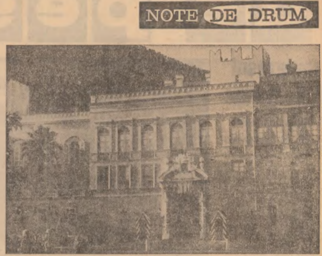
Palatul princiar din Monaco, capitala statului iliput, cele-bru, deopotroiva...