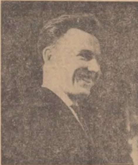
Ultima deliberare... înainte de a fi pe locul