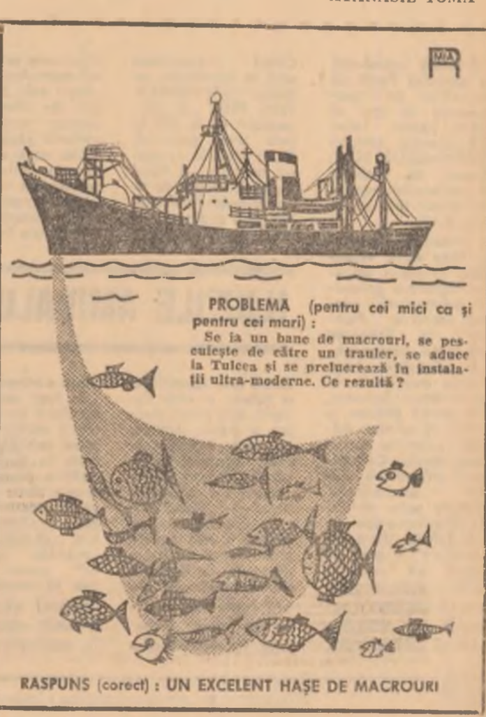
RASPUNS (corect) : UN EXCELENT HAȘ DE MACROURI