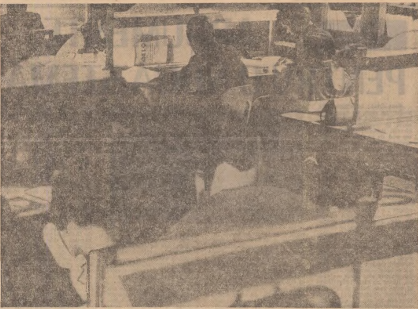
Cartea, însoțitorul nedespărțit al viitorului specialist