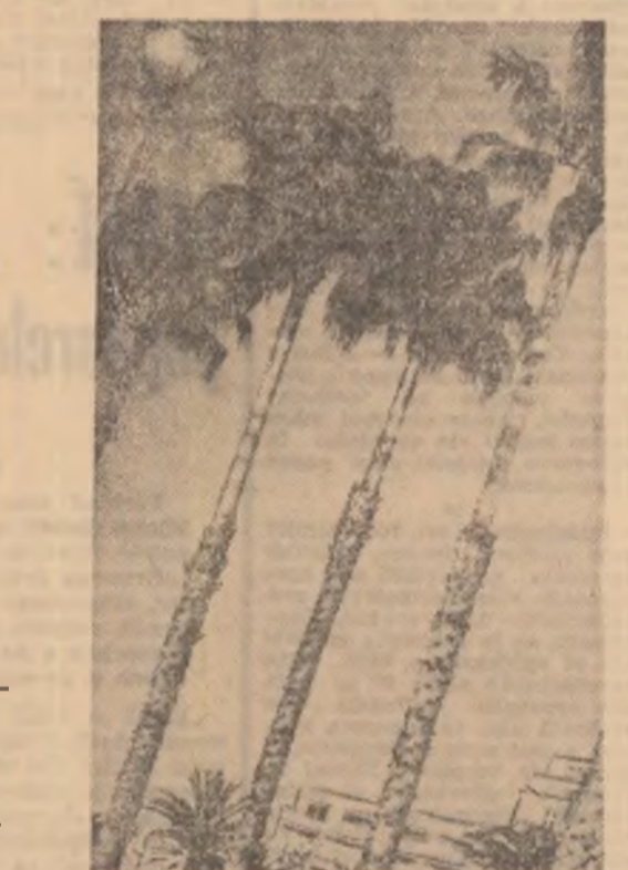
Palmieri sub soarele sudului...

exagerată, așa cum a fost cazul „Baladei pentru un cîine” de Gerard Verger, sau „Zilele lui Mathieu” de W Leszcynski sau altele. Criza singurătății la bătrînețe sau cazul particular, aproape patologic de inadaptable a unui tîran la viața satului au fost supralicitate de unii tineri participanți la discuțiile festivalului, cred eu, numai din dorința de a exprima ritos dispretul față de instituțiile bur-