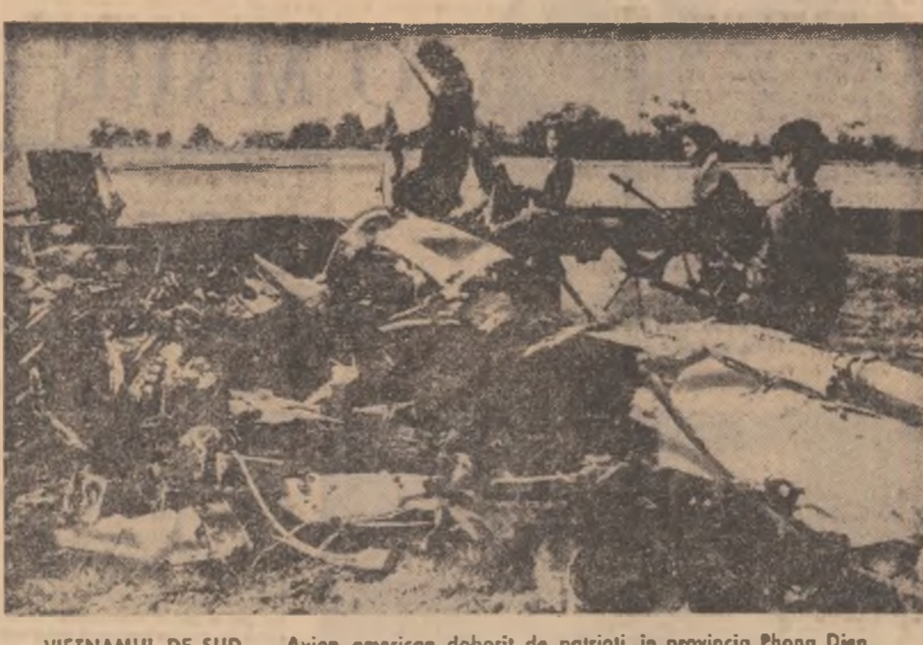
VIETNAMUL DE SUD. — Avion american doborât de patrioți în provincia Phong Dien

SAIGON 12 (Agerpres). — Poporul vietnamez are dreptul la autodeterminare pentru a putea rezolva el însuși problemele reglementate de Thien Hoa, unul din principalii lideri budiști, într-un mesaj adresat clerului și fideliilor cu prilejul Anului nou lunar. Budiștii, se afirmă în mesaj, sînt împotriva tuturor celor ce se pronunță în favoarea prelungirii războiului. Această acuzație, după observatori politici, este adresată în primul rînd conducătorilor regimului Saigon, generalii Thieu, și guvernului său, care a declarat în prezent o campanie împotriva budiștilor pentru pace. În ultimul timp au mai fost semnalate și alte reacții similare din partea unor cercuri budiiste care se bucură de o mare influență în rîndul populației.