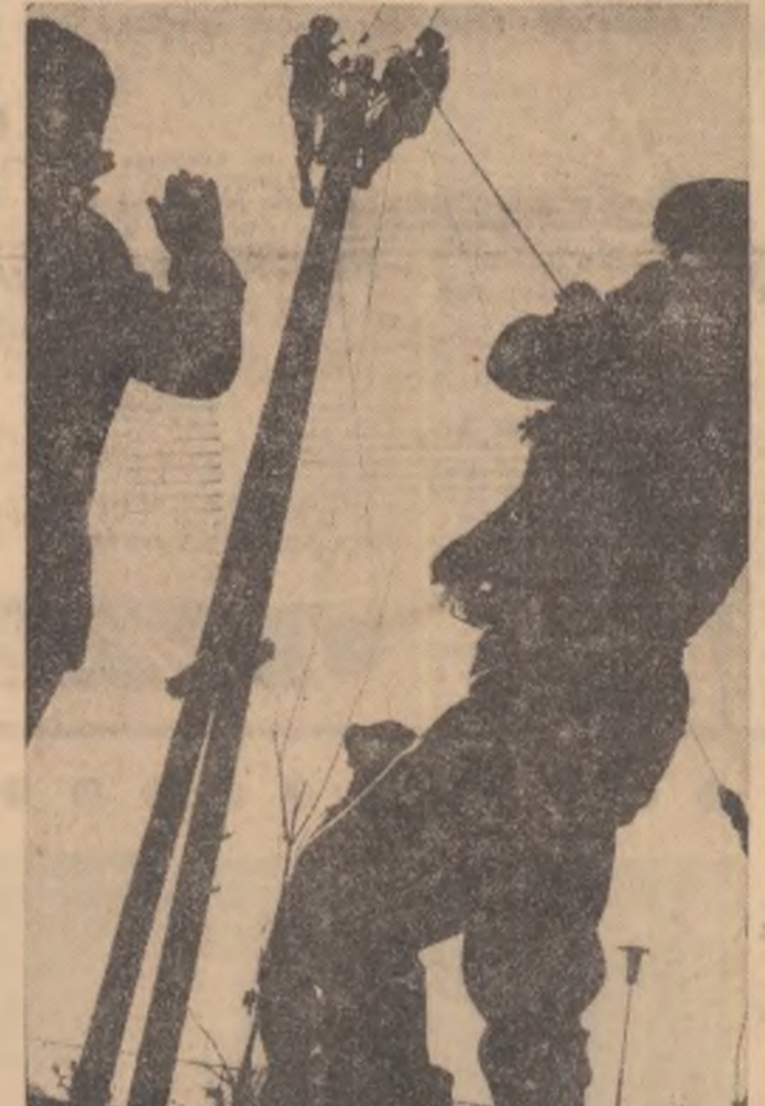
Cu ani în urmă, curentul electric pătrundea și în comuna Tudor Vladimirescu. Azi, pe străzile drepte ale comunei de pe șoseaua Galați — Tecuci, continuă să se ridice noi stilpi ai iluminatului. Lumina trece, astfel, pe o nouă treaptă...

Tinărul își continuă destăinuirea, găsind cu greu cuvintele, din cînd în cînd, scoate câte o hîrtie din buzunar — aceeași — mi-o întinde s-o citească, apoi iar caută cuvinte și se frîmîntă pe scam. „Inovația mea se numește «freză mele cu dinți demonstabili». Mulți au încercat să realizeze o astfel de freză... M-am gândit la ea câteva săptămîni, apoi m-am dus la cabinetul tehnic cu un dosar. Mi s-a răspuns, însă, că eforturile mele sînt cîrta, și că, din punct de vedere tehnic, nu au reușit alții, bine cunoscuți ca inovatori, cum aș fi putut să reușesc eu... Atunci, m-am hotărît să execut freza singur, să demonstrez că se poate. Am luat un corp de freză vechi, reformat, și niște broșe care urmau să meargă la rețopit; m-am dus cu ele la forj și l-am rugat pe un muncitor să mi le forjeze după indicațiile mele, apoi am executat singur celelalte operațiuni, după program. Cum tocmai în acel timp mi s-a dat concediu, am renunțat la odihnă și săptămîna și mi-am terminat freza, prototipul. În prezența tovarășilor de la cabinetul tehnic și a altor specialiști a avut loc proba. Față de freza importată, a mea avea o productivitate aproape dublă”.