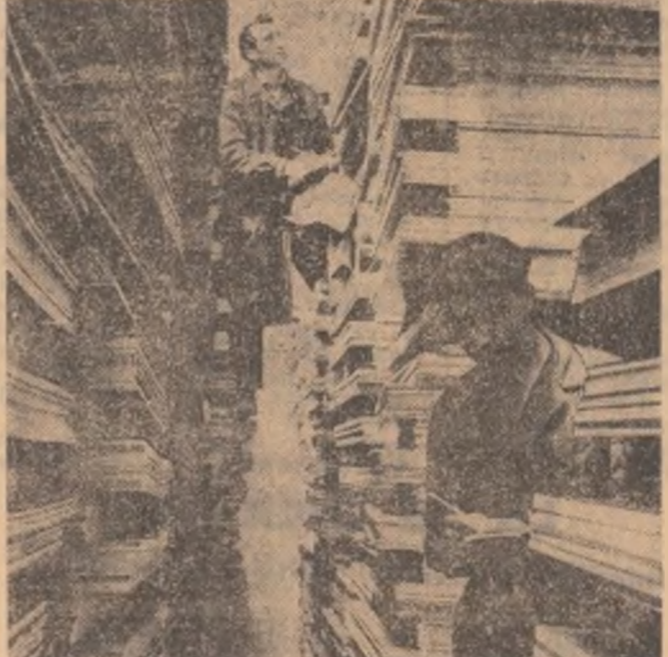
C.I.L. Blaj dispune de cea mai mare fabrică de plăci din Europa. În fotografie: Aspect din magazia de produse finite

Devenirea la care sînt supuse valorile este, așadar, un aspect logic al existenței lor ca determinări și determinate ale societății în evoluția sa istorică.