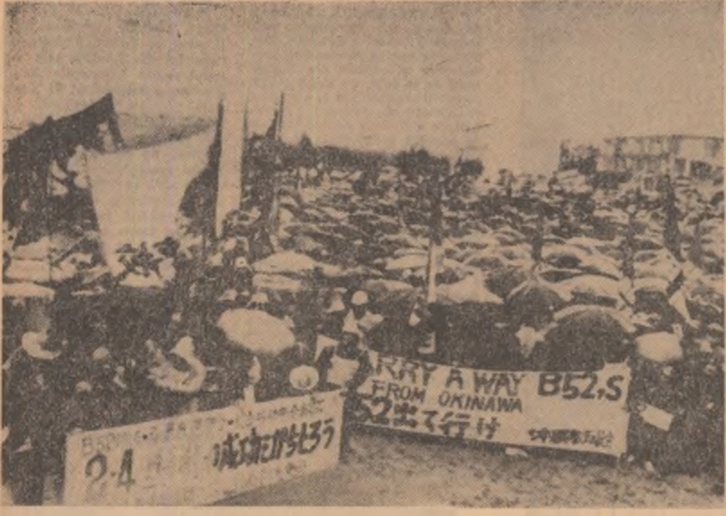
CONGRESUL PARTIDULUI COMUNIST ITALIAN