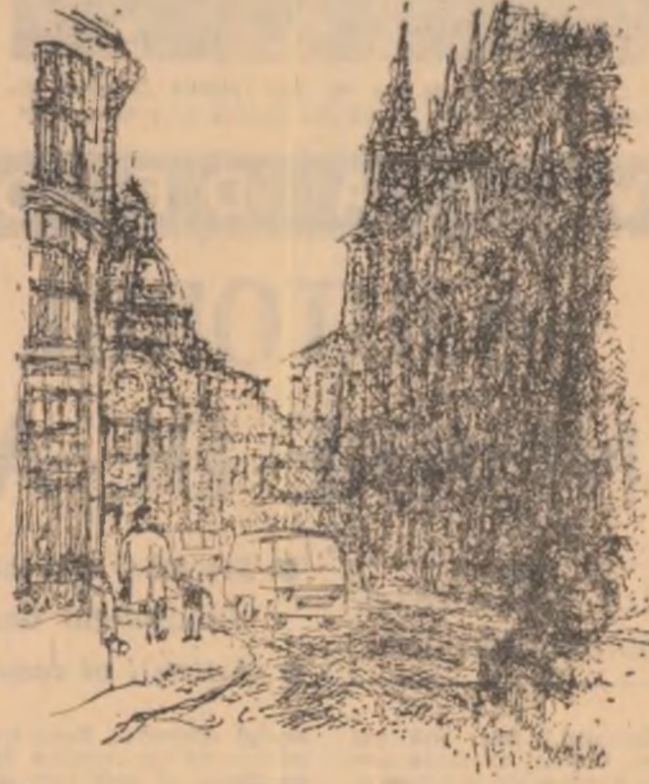
MIHU VULCĂNESCU: imagine din albumul „București”, aflat în pregătire

— Ce vă preocupă în prezent? — Am predat recent o carte pentru copii la „Editura tineretului”; lucrez la un volum: „București”, alcătuit din 80 de planșe reprezentînd imagini din străzile vechi ale Capitalei; am terminat un triptic vînd ca temă muzică — pe care îl voi trimite la o expoziție de grafică europeană la Varsăvie.