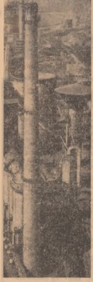
Vedere a „Cetății de foc“