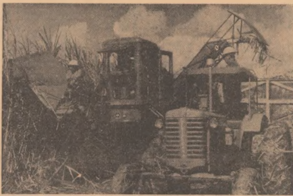
CUBA. — Aspect de la recoltarea trestiei de zahăr în provincia Matanzas