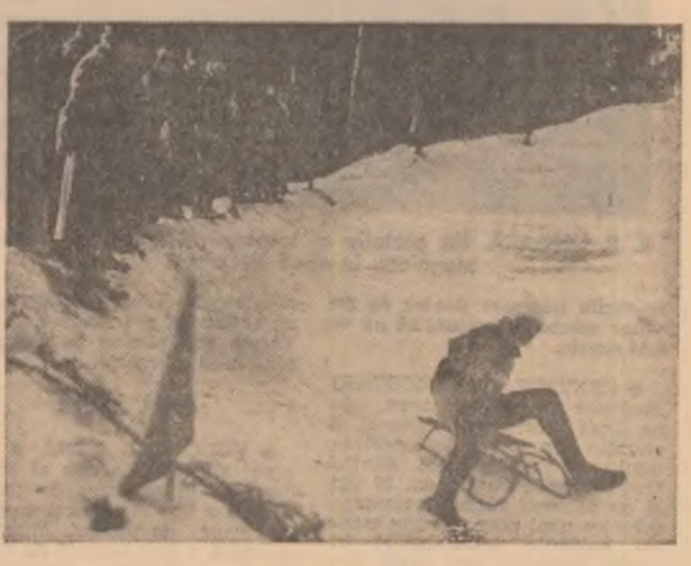
În turnantă, secvență din disputa fetelor