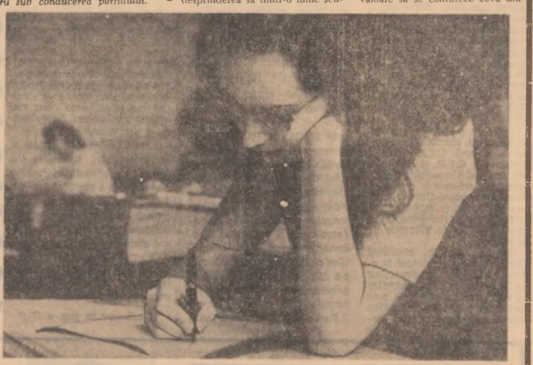
Duminică, mii de elevi au luat startul într-o tradițională competiție a hârniceii și a bunei pregătiri: concursurile de literatură română, matematică, fizică și chimie. Fotografia de mai sus surprinde un aspect de la concursul de literatură română, prima fază, care s-a desfășurat la Liceul „I. L. Caragiale” din Capitală

tala indiferență, călduța pasivitate în care s-au complăcut, fără excepție, tinerii prezenți? Să fie vorba oare de timiditate? De puțina obișnuință de a vorbi în public? Puțîn probabil, pentru că „publicul” era reprezentat de colegii mai vîrstnici de muncă, de oamenii care au aceeași preocupări și același scop: randamentul superior al întreprinderii. Adevărul este că, pasivitatea prezintă reflexul sistemului de lucru al comitetului U.T.C., neînțelegerea de către organizația U.T.C. a datoriei de a-și face cunoscut punctul de vedere într-o problemă atît de importantă. Optica actuală, străină sarcinilor majore ce revin tinerilor organizațiilor U.T.C. din unitățile productive, trebuie fundamental schimbată.