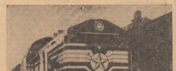
R. P. UNGARA. Un prototip al locomotivei Diesel hidraulice maghiare, în curs de probă