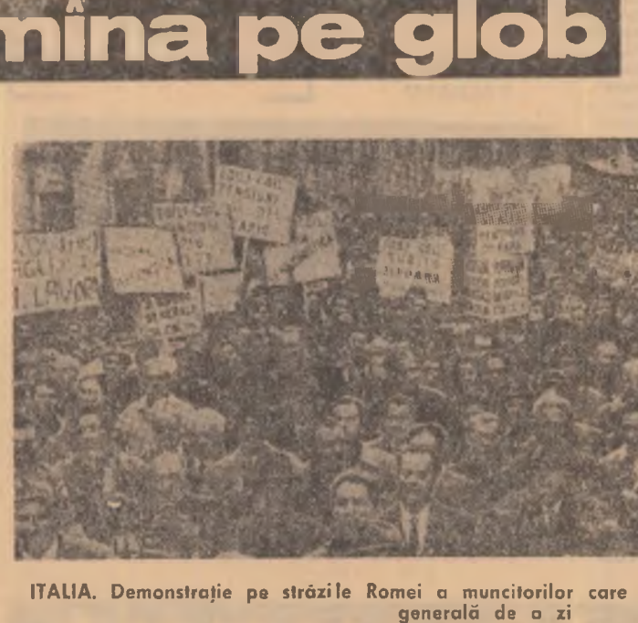
ITALIA. Demonstrație pe străzile Romei a muncitorilor care au luat parte la recenta grevă generală de o zi