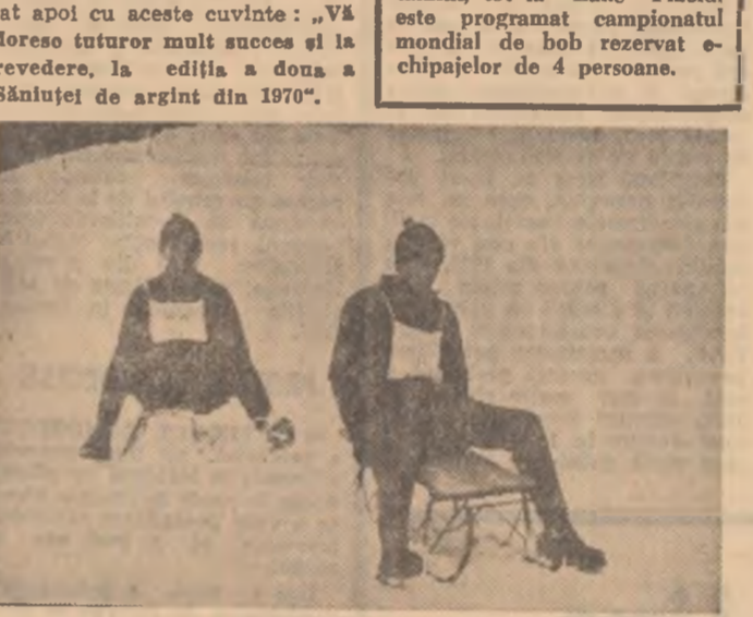
Duel pasionant în proba rezervat băieților