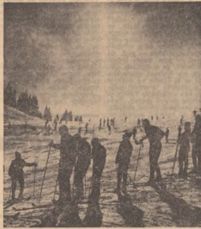
Pe pîrta înzăpezită

E un punct de vedere zăbănit? Nu. Pentru că acest sol de laude nu ne-a adus nimic bun.