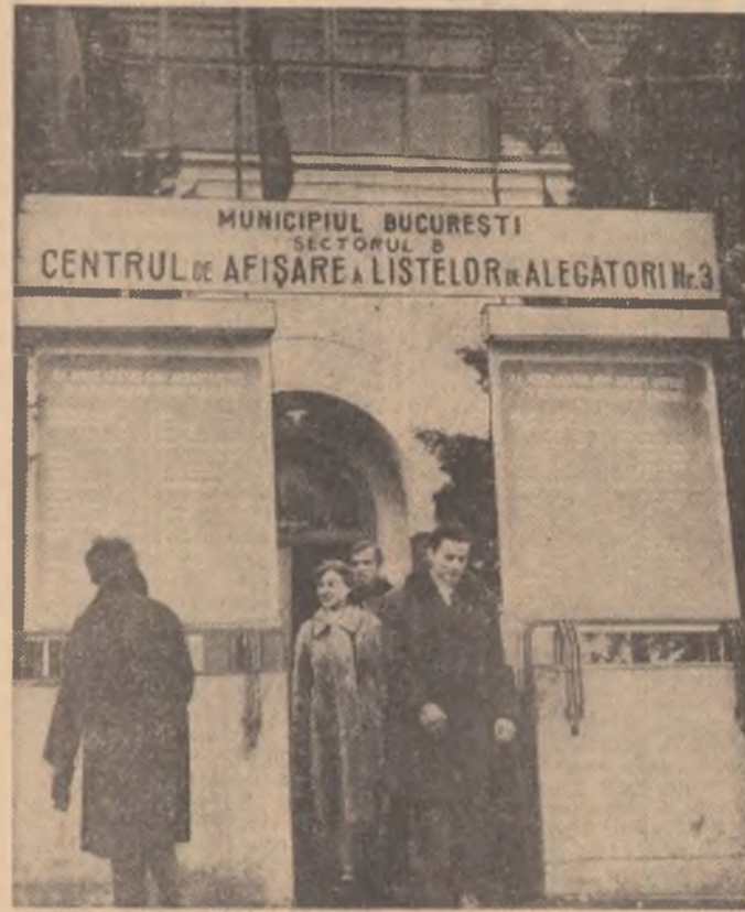
Ieri, numeroși cetățeni au verificat listele de alegători. Fotoreporterul nostru a surprins un instantaneu la Centrul de afișare a listelor de alegători Nr. 3 din sectorul VIII

CRĂCIUN VASILE Subredacția „Știința tineretului” Gorj (Continuare în pag. a II-a)