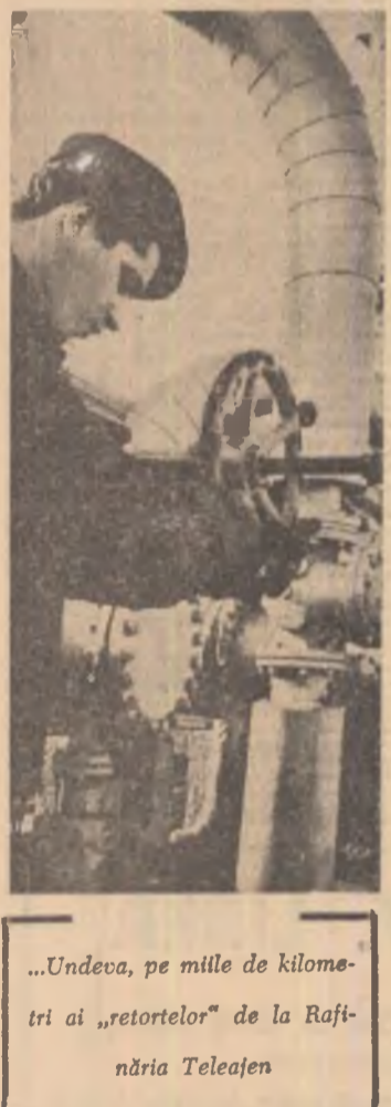
„Undeva, pe mii de kilometri ai „retoretelor” de la Rafinăria Teleajen