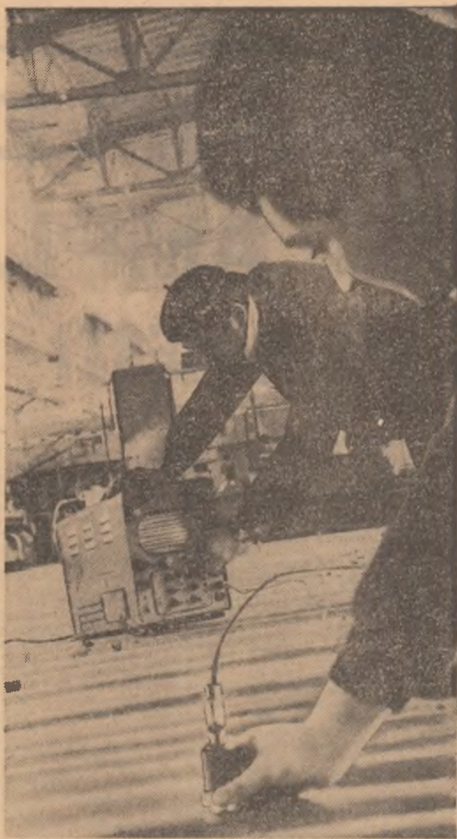
UZINA DE ALUMINIU SLATINA. — Se execută controlul ultrasonic al barelor de aluminiu