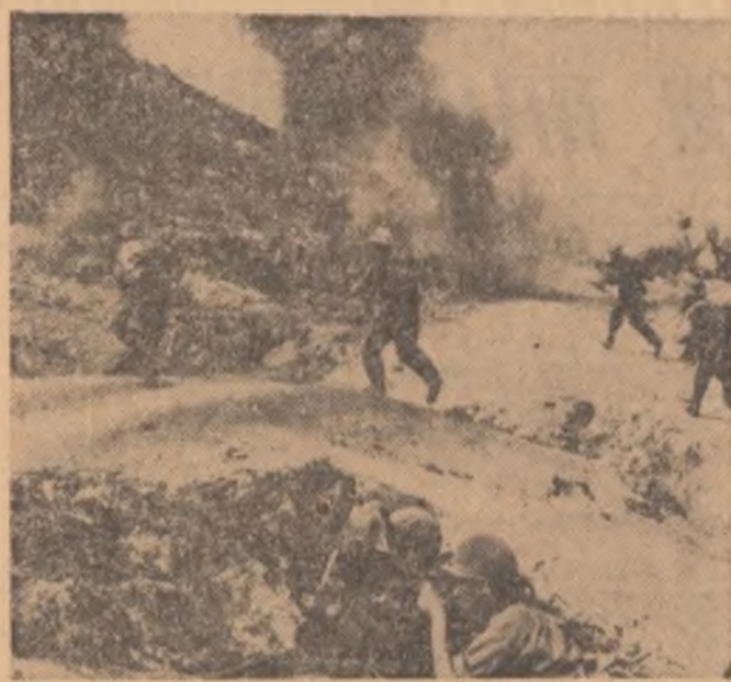
VIETNAMUL DE SUD. — Patrioți în timpul unui atac în regiunea Quang Tri

Încercând să contracareze acțiunile patrioților, care au reușit să străpungă mult lăudată „cercură de siguranță” a Saigonului, forțele aeriene „B-52” au bombardat întreaga noaptea, fără încetare, lansând peste 1.500 tone de bombe asupra regiunilor considerate că țar adăpost pentru patrioți. Dar, cum aceștia și-au menținut prezența în imediata vecinătate a Saigonului, bombe americane au căzut la mai puțin de 30 kilometri de capitală, în regiunea cea mai populată a țării. Cifrele aproximative furnizate de oficialitățile S.U.A. de la Saigon, corespondentul agenției U.P.I. menționează că în primele trei zile ale ofensivei lansate de patrioți sud-vietnamezi au fost ucis peste 200 de soldați și ofițeri americani.