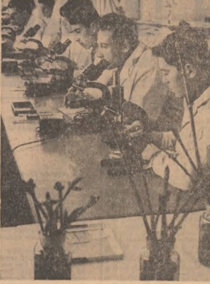
In laboratorul de botanică al Institutului pedagogic de 3 ani din Pitești.