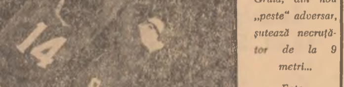
Cruiă, din nou „peste” adversar, citează necruștor de la 9 metri...