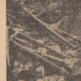
Reproducem după ziarul „TIMES” o fotografie înfățișînd distrugerile provocate de bombardamente în orașul Umuahia (Nigeria)

● SIRHAN BISHARA SIRHAN a recunoscut, luni, pentru prima dată, de la începerea procesului ce-i este intentat, că a tras asupra senatorului Robert Kennedy. El a afirmat că în acel moment „nu era conștient de acțiunile sale”. Avocații apărării încearcă să demonstreze că acțiunea lui Sirhan nu a avut un caracter premeditat, ci a fost o urmare a unei boli mintale. În cazul în care argumentele aduse nu vor convinge juriul, Sirhan ar putea fi condamnat la moarte.