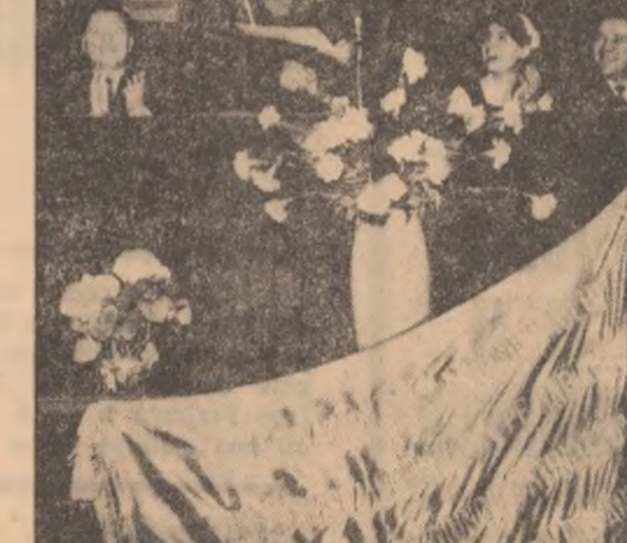
BUCUREȘTI: premiul special

muncii voluntar-patriotice ale tineretului din întreaga țară de către tovarășul ION PO-