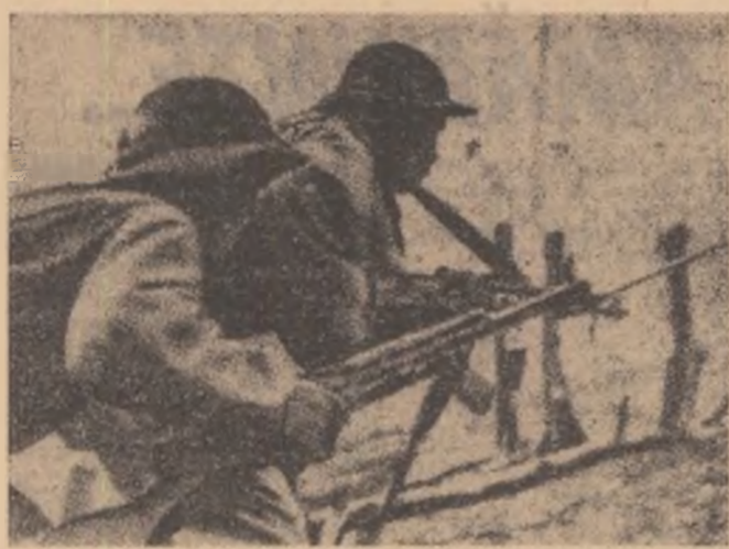
Vietnamul de sud. Membri ai F.N.E. în timpul unei acțiuni

Agencia de presă ELIBERAREA a difuzat un comunicat referitor la succesele obținute de forțele patriotice sud-vietnameze din regiunea platurilor înalte în ultima săptămână a lunii februarie. În această perioadă — precizează agenția — unitățile Frontului Național de Eliberare din Vietnamul de sud, care acționează în această zonă au atacat peste 40 de poziții fortificate ale forțelor americano-saigoaneze și au scos din luptă aproximativ 1400 militari inamici. Activitatea patrioților a fost concentrată mai ales în sectoarele Kontum, Pleiku, Ban Me Thuot, Dak To, unde trupele americano-saigoaneze dețineau importante instalații militare. În cursul luptelor, relatează agenția Eliberarea, detașamentele F.N.E. au doborât sau avariat la sol 22 de avioane și au distrus aproximativ 80 de vehicule militare și 20 de depozite de muniții ale forțelor inamice.