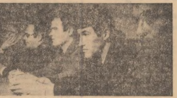
O parte din lotul de handbaliști în mijlocul admiratorilor din Sibiu

Întilnirea de la Sibiu, organizată de ziarul nostru și secția propagandă a C.N.E.P.S., a doua dintr-un ciclu de întilniri dintre tinerii din diferite orase și sportivii lor preferați, a început așteptările. Ea s-a transformat într-un coloziu despre viață și despre sport, despre ceea ce le reunește — pasiunea și răspunderea socială. Dialogul, plin de violențe și inedit, prin interesul manifestat de cei care au tinut cu tot dinadinsul să „ancheteze handbalul românesc”.