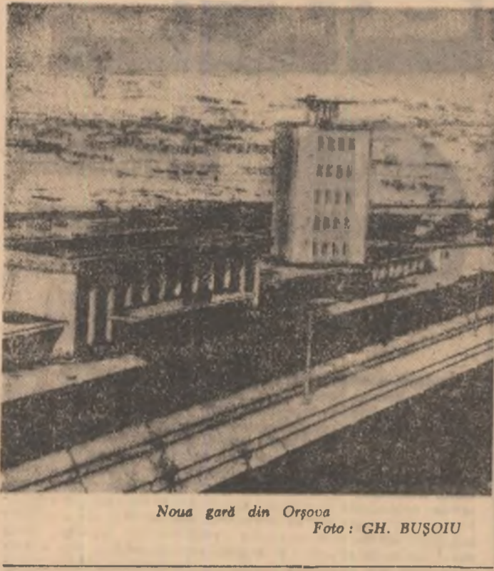
Noua gard din Orșova