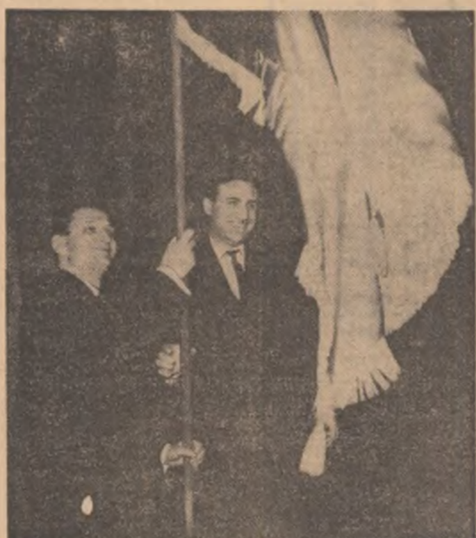
PRAHOVA: pentru a treia oară consecutiv

Așa își începea relatarea, în martie 1967, reporterul, consemnînd semnificația momentului festiv. Cu cuvinte asemănătoare, reporterul anului următor transmitea din același loc — același eveniment: organizația județeană Ploiești a U.T.C. primea, pentru a doua oară, distincția localului I. Și iată-l astăzi, pe reporterul anului 1969, transmițînd din aceeași sală a clubului Uzinelor „1 Mai”: organizația județeană Prahova a U.T.C. cîștigă, pentru