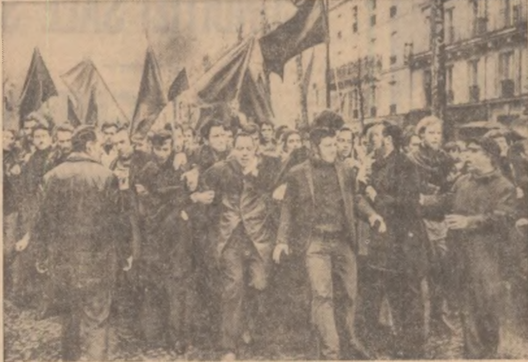
FRANȚA. Aspect din timpul unei demonstrații de masă care a avut loc la Paris cu ocazia recentei greve generale de 24 de ore