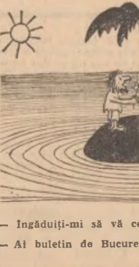
— Îngăduiți-mi să vă cer mîna... — Al buletin de București? V. CRIȘAN