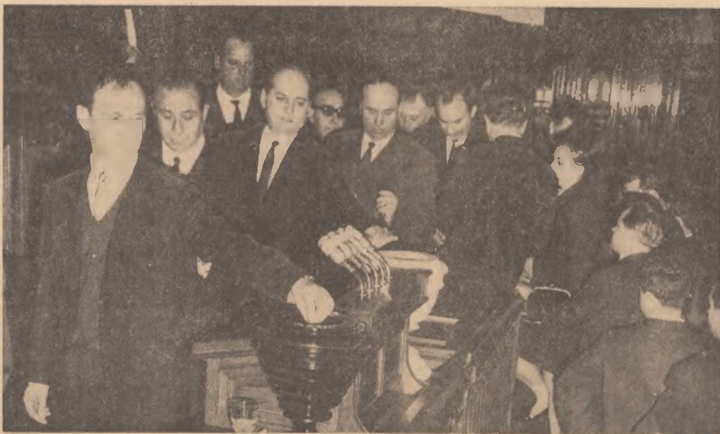
În timpul sesiunii