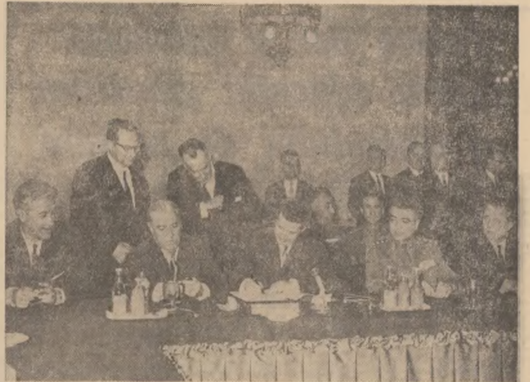
Delegația română în timpul semnării Apelului

Dineul s-a desfășurat într-o atmosferă cordială, tovarășească.