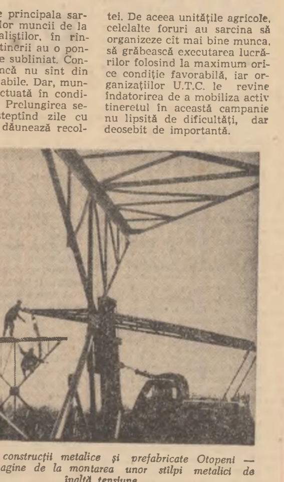
Întreprinderea construcțiilor metalice și prefabricate Otopeni — București: Imagine de la montarea unor stâlpi metalici de înaltă tensiune

Masa rotundă realizată de: LUKREȚIA LUSTIG MARIETA VIDRASCU