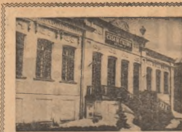
Fațada casei Heliade (str. Mircea Vodă nr. 51) cu firma care acoperă frumoasele detalii arhitectonice

— Dar activitatea acestor consilii populare ale sectoarelor cine o coordonează, cine o îndrumă și o controlează? Am întreat. Răspunsul a venit logic, implacabil: „evident tot Consiliul popular al municipiului București”. Curiozitate „central” și a vremii a societății bucureștene: nu-a făcut alt decât să ne ghidăm în direcția Direcției de studii, studii în plan central al orașului (str. Biserica Doamnei nr. 11, monument datat din 1683, ctitoria doamnei Maria soția lui Șerban Cantăreanu, păstrătoare și a sursele dintre cele mai interesante picturi originale, la fațada și pe fațadele laterale în zona de protecție impusă de lege monumentelor, de lîngă cu sticlă opacă, case), opere de arhitectură, sticlă, pictură, etc. și de arhitectori și de constructori și