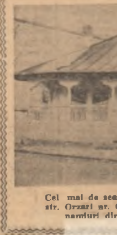
Un aspect — e drept foarte puțin plăcut — al exteriorului casei din str. Orzari nr. 83