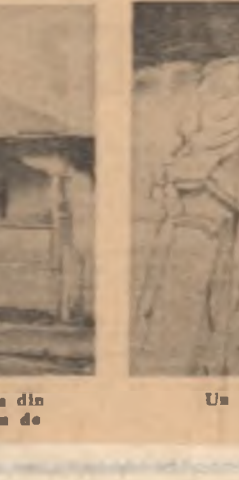
Un aspect — e drept foarte puțin plăcut — al exteriorului casei din str. Orzari nr. 83