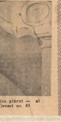
Un aspect — e drept foarte puțin plăcut — al exteriorului casei din str. Orzari nr. 83