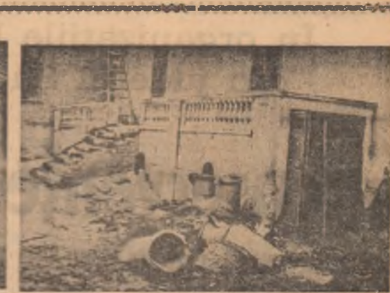
Curtea interioară a casei Heliade, în stînga fotografiei se poate observa o construcție nouă, neaprobată de D.M.I.