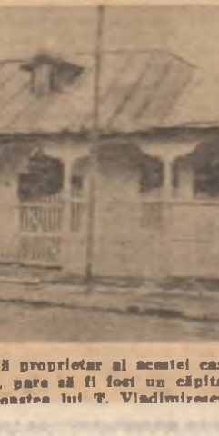
Un aspect — e drept foarte puțin plăcut — al exteriorului casei din str. Orzari nr. 83