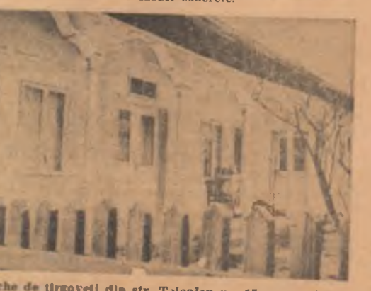
Casa veche de țirgoț’ din str. Teleajen nr. 15, care așteaptă să fie declarată monument de arhitectură

În multe din localitățile patriei noastre există numeroase monumente de arhitectură de o reală valoare. Obiect de studiu pentru cercetători, ele constituie în același timp și un important mijloc de educație pentru tineretul nostru, care are astfel posibilitatea de a veni la contact direct cu valorile culturale ale trecutului. Prin clarificarea forțelor de apăsare, multe dintre ele sînt scese în afara oricărui pericol de degradare. Numărul monumentelor de arhitectură este însă cu mult mai mare decît cel pe care îl cunoaștem și acțiunea de conservare și popularizare a lor nu se poate face încheiată. Sînt, însă, numeroase situațiile în care monumente de arhitectură sînt intrate în conștiința publicului și astfel în perioada de degradare. Altele s-au pierdut, fiind irremediabil pierdute. Altele sînt în pericol prin divizarea înfinită a atribuțiilor între diverse instanțe, direcții, comitete, divizare care facilitează imens evaziunea răspunderilor în diverse cazuri concrete.