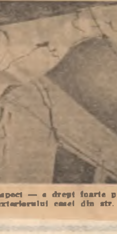
Un aspect — e drept foarte puțin plăcut — al exteriorului casei din str. Orzari nr. 83