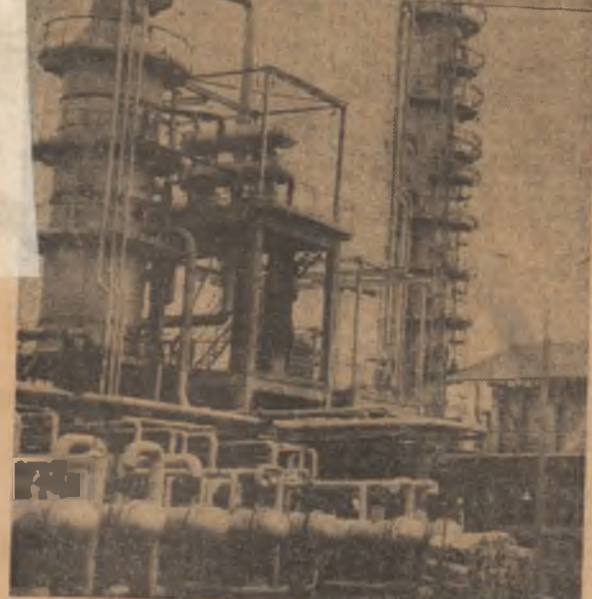
Infirmeria „Grigora” din Spitalul de Borești, județul Bihor. Noua unitate proiectată de specialiștii ai Institutului de proiectări și instalații petroliere din Ploiești, are o capacitate de prelucrare de 300.000 tone țifei pe an

GH. GHIDRIGAN (Continuare în pag. a III-a)