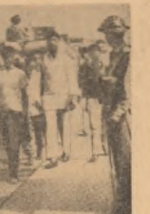
PAKISTAN. — După declararea stării de asediu, armata supraveghează circulația în Capitală