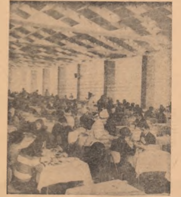
O masă gustoasă și consistentă poate fi scrisă rapid, într-o ambianță intimă, la cîntina studenților țeseni

Desigur, în artă, trebuie să vii cu ceva propriu, cu expresivitate, cu un nou, care