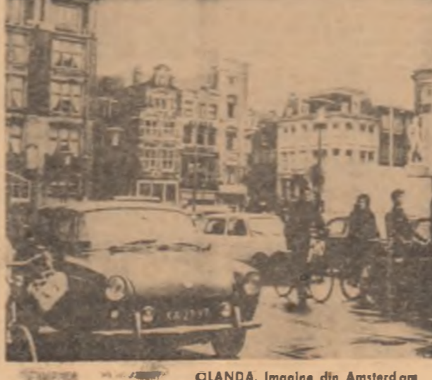
OLANDA. Imagine din Amsterdam

DR. BARNARD LA A IV-A TRANSPLANTARE A UKEI INIMI A doua zi după operația de transplantare a inimii, cel de-al patrulea pacient al celebrului chirurg sud-american, Christian Barnard, se simte satisfăcut, a anunțat un purtător de cuvânt al spitalului de la Grote Schuur, unde a avut loc luni intervenția chirurgicală. Numele noului pacient, ca și cel al doilea, nu au fost date publicității, conform unei legi tuată de Christian recent adoptată în Africa de Sud: s-a purtătorul de cuvânt, menționat numai că bolnavul este un alb, elncisprezece minute,