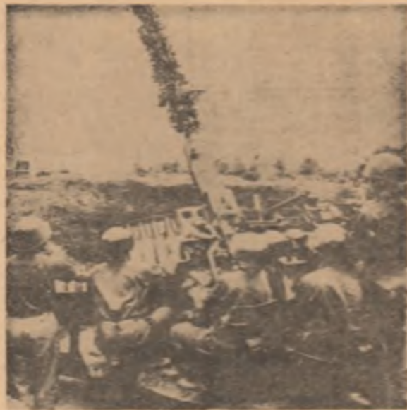
R. D. VIETNAM — O subunitate a apărării antiforene gata pentru a riposta agresorilor

WASHINGTON. — Regala Hussein al Iordaniei, care a sosit într-o vizită oficială de trei zile în S.U.A., a avut marți o primă întrevedere cu președintele Richard Nixon. Purtătorul de cuvânt al Casei Albe a anunțat că întrevederea a fost consacrată situației din Orientul Apropiat, în general, și consultării cadrului partit de la Națiunile Unite, în special. El a adăugat că următoarea întâlnire între regele iordanian și președintele Statelor Unite este prevăzută pentru joi.