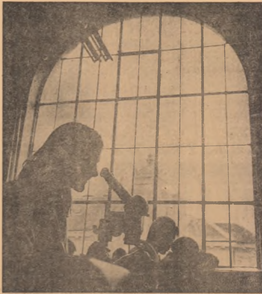
Laboratorul de botanică al Institutului agronomic din Timișoara

că în ziua de 6 aprilie 1969, la orele 23,20, s-a introdus materia primă în primul cuptor din complexul de piroliză — moment care marchează începutul fluxului tehnologic.