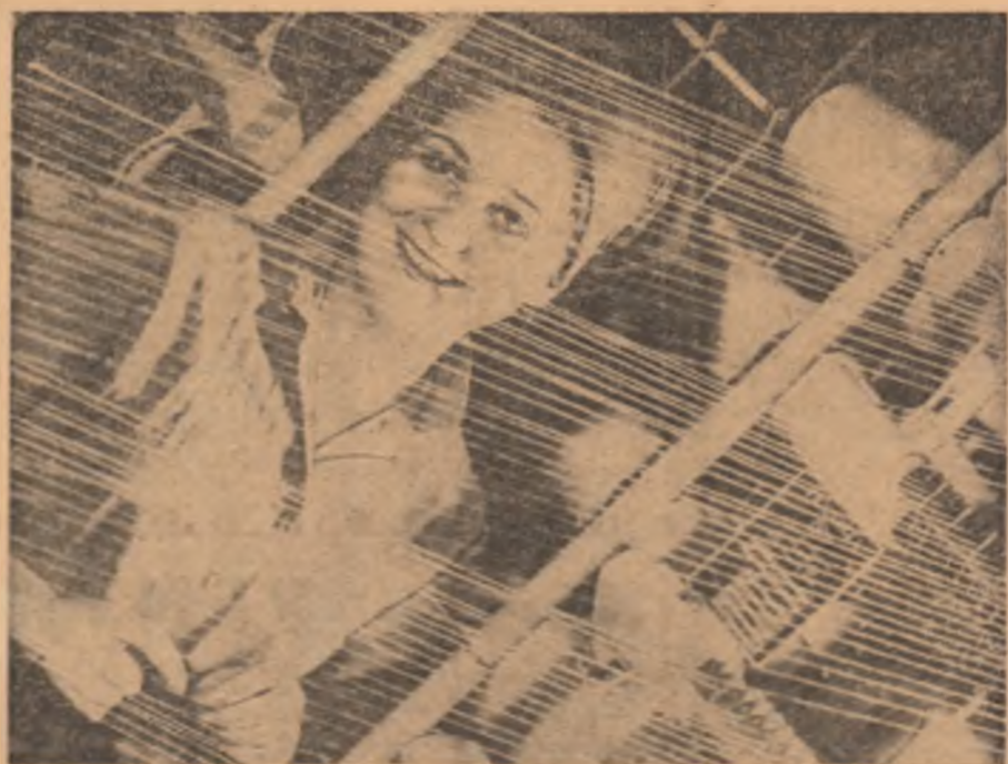
„Zimbete pe „portavocele” țesăturilor