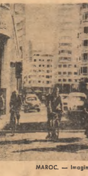
MAROC. — Imagine din Casablanca

LA 14 APRILIE, ministrul U.R.S.S. a sosit luni la Paris pentru a duce tratative în legătură cu dezvoltarea relațiilor comerciale dintre Uniunea Sovietică și Franța, anunțat agenția TASS. Anul acesta expră termenul acordului comercial pe termen lung dintre cele două țări. În perioada 1965-1969 pentru care fusese semnat acordul, schimburile de mărfuri dintre cele două țări s-au dezvoltat favorabil, crescînd de 1,5 ori față de perioada precedentă de cinci ani.