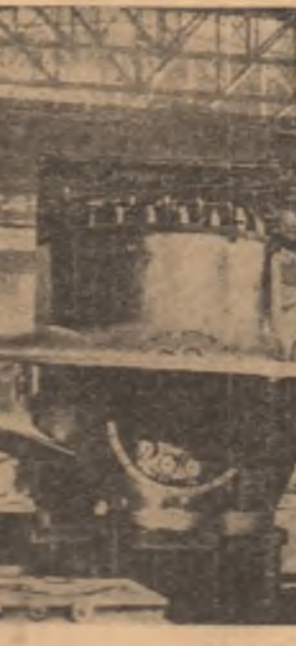
U.R.S.S. — Imagine de la o uzină leningrădenă producătoare de turbine

Congresul a hotărât să înlocuiască Secretariatul Prezidiului Congresului cu Comitetul Central al Partidului Comunist Chinez și a „Statutului P. C. Chinez”. Ședința din 14 aprilie a Congresului național al Partidului Comunist Chinez a fost prezidată de tovarășul Mao Tze-tun, care a rostit o cuvântare. Ca începerea de la 15 aprilie, cel de-al IX-lea Congres național al P.C. Chinez va trece la cel de-al treilea punct de pe ordinea de zi: alegerea Comitetului Central al Partidului Comunist Chinez.