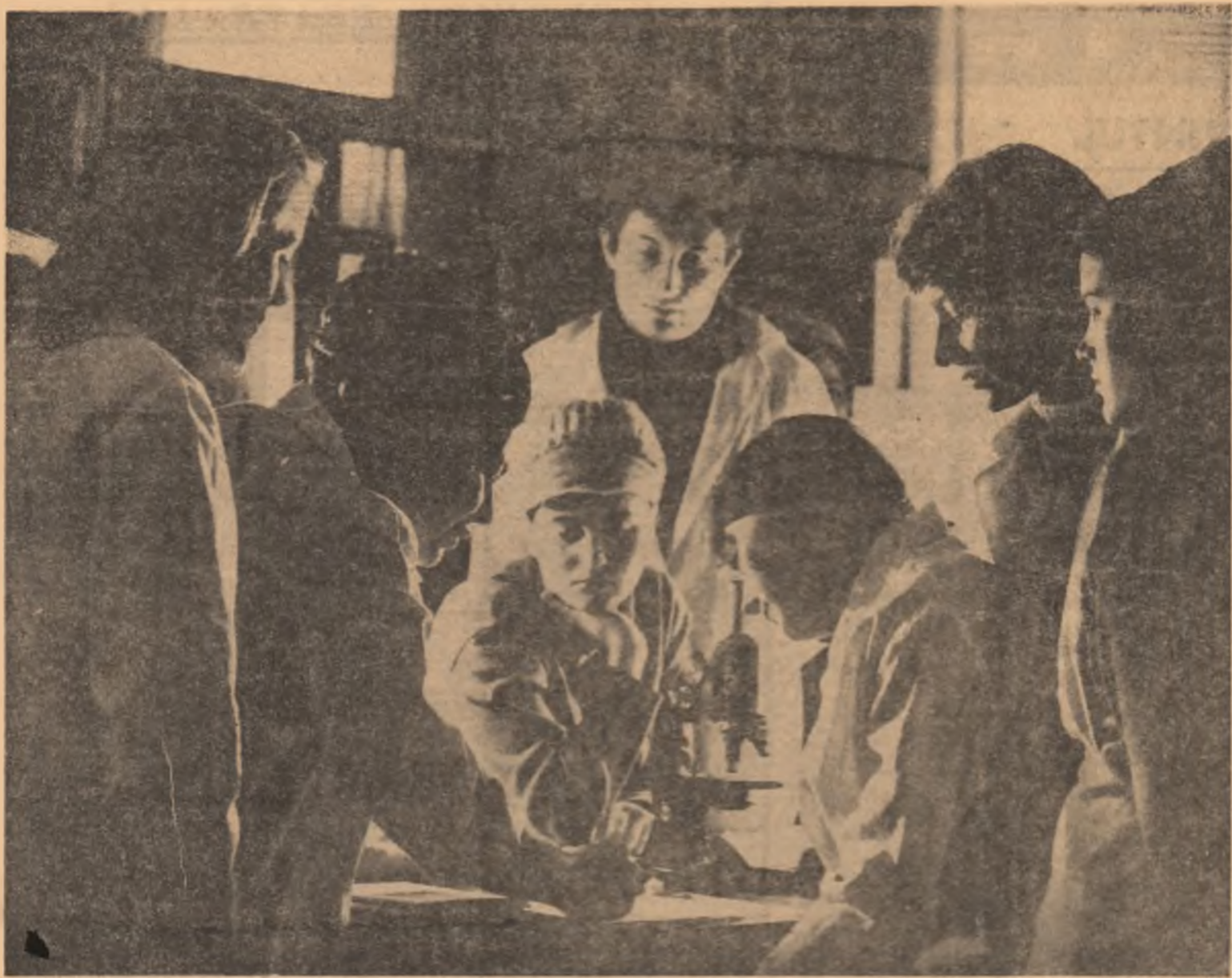
O ORĂ DE PRACTICĂ. Halatul imaculat, aparatele ultrasensibile, instrumentele așteptând să dea senzațe gesturi precise, planșe cu parametri optimi, cadrans cu cifre vii, compun o atmosferă specifică studiului practic — dar peste toată această veghea străbătătoare a studentului. Aici, printre organele de mașină, printre circuitele electrice și benzii olfactive, poate că un mare viitor savant încearcă emoția primului rezultat real, sau revelația bruscă a primei idei direcționale în creația științifică cotidiană. Seriozitatea, pasiunea și continuitatea cu care studenții se pregătesc aici, sînt atributa care deopotrivă îi vor caracteriza și la locul de producție. Anii de ucenicie sub îndrumarea competentă a profesorilor sînt toți acești ani de facultate care se depun ca fundament cîtora profesiei.