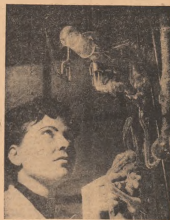
În laboratorul Uzinei „Electroputere” — Craiova

parea conducătorilor partidelor comuniste și muncitorești și a șefilor de guvern din țările membre ale C.A.E.R.