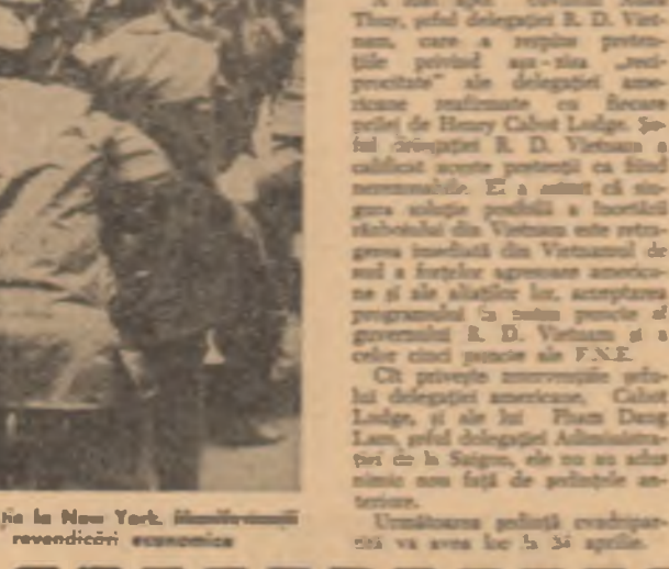
Ciocnirea între manifestanți și poliție în New York. Manifestanții au cerut satisfacerea unor revendicări economice.